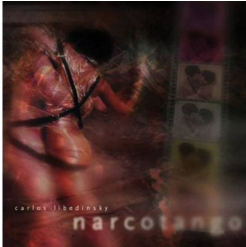
Imagen 1. Tapa del primer disco del conjunto Narcotango, año 2003.

go, 9 Bajofondo 10 y Gotan Project. 11 Recurriendo a nuestra propuesta central, intentaremos analizar estas composiciones haciendo especial hincapié en las representaciones construidas en torno al cuerpo femenino y al rol de la mujer dentro de esta expresión musical. En primer lugar, analizaremos por separado las tapas de cada uno de los conjuntos mencionados; en segundo lugar, presentaremos una comparación entre ellos.