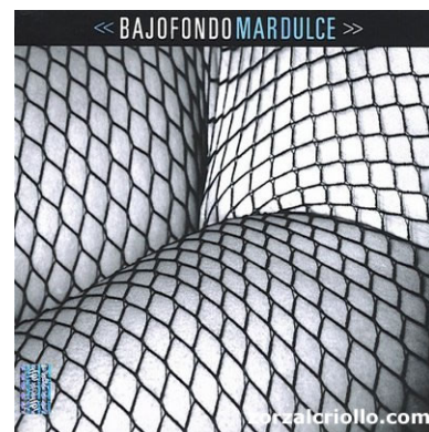
Imagen 2, 3 y 4. Tango Club , 2002; Supervielle , 2004; Mar Dulce , 2007.