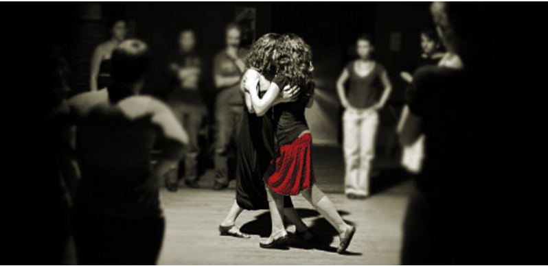
Imagen 10. Fotografía tomada por Emily Anne Epstein en una clase de tango queer, utilizada para publicitar el VI Festival Internacional de Tango Queer en Buenos Aires. Edición 2012.

remite a los modos prototípicos del tango: llevan sandalias y zapatos sin taco.