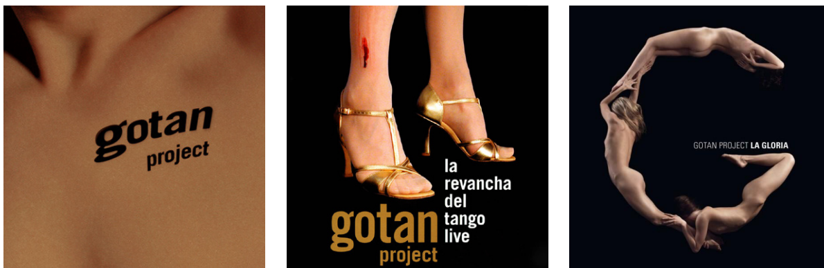
Imagen 5, 6 y 7. La Revancha del Tango, 2001; DVD show en vivo, 2005; Tango 3.0, 2010.

vale decir, a un tango “desprejuiciado” y “sexuado” que fue corroído por los “cánones civilizatorios” de principios de siglo XX (Varela, 2005).