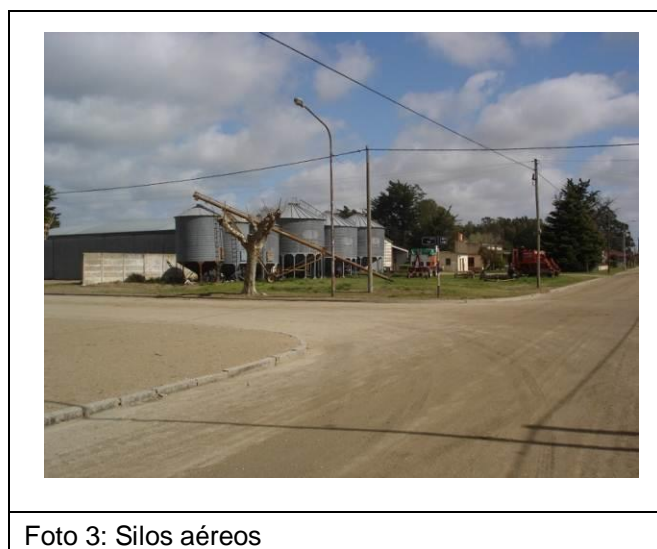
Figura 3. Fotos representativas de las actividades vinculadas al espacio rural que se desarrollan en el pueblo de Gardey.

La práctica de aplicación de agroquímicos que se realiza a proximidad del pueblo provoca descontento y preocupación entre sus habitantes, al mismo tiempo que genera una afección en los componentes ambientales.