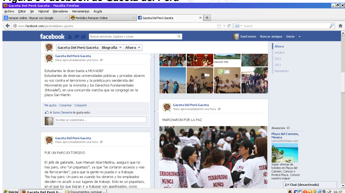
Figura 3 Facebook de Gaceta del Perú

Si tomamos como referencia julio de 2012, el sitio de Facebook tenía un total de 846 “amigos” de los cuales 95 no eran ‘individuos’ sino ‘comunidades’. De estos 96 amigos, 11 eran ‘medios de comunicación’. Sólo 3 “amigos” correspondían a periódicos de migrantes peruanos en la Argentina ( Cholo con Che , El Heraldo del Perú y Sol del Perú ). Estos tres, a su vez, se relacionan entre sí, pero no establecen con frecuencia links en común con la Gaceta del Perú , con la excepción de festividades que engloban a toda la colectividad como, por ejemplo, “Feria Cultural Perú”, realizada en la Plaza Perú de Buenos Aires en noviembre de 2012 y auspiciada por el Gobierno de la Ciudad de Buenos Aires. También entre los tres periódicos comparten muchos “amigos” como ‘instituciones’ de la colectividad. Esta confluencia remite a una red virtual que reproduce y/o se superpone con una real (Finkelievich, 2007; Kolloock y Smith, 2002).