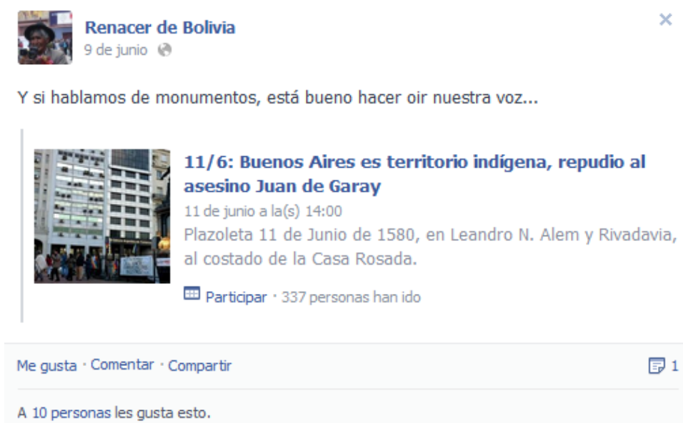
Figura 6 Convocatoria por derechos de los indígenas