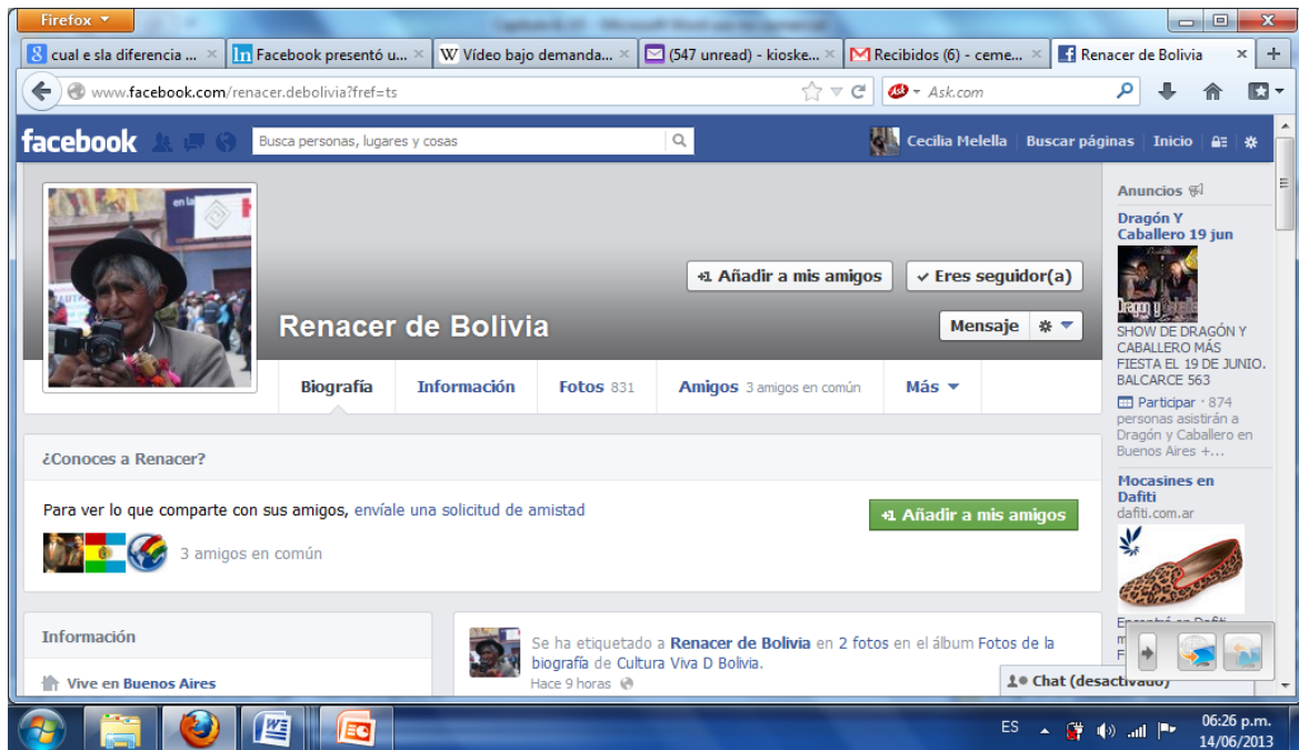
Figura 5 Facebook de Renacer

Renacer no sólo reproduce su propia información sino que “sube” o “comparte” información de otros medios (desde medios hegemónicos como el diario argentino La Nación hasta de medios alternativos, videos de You Tube 20 o contenidos de otras páginas Web). Con todo, es relevante que permite que sus contactos o “amigos” lo “etiqueten” en sus publicaciones (por lo que automáticamente esa información quedará registrada en su muro y otros “amigos” la verán) y consiente que sus “amigos” peguen información en su muro. Hay interacción, participación por parte de los “amigos” que evidencia una construcción colectiva del conocimiento, de la noticia, del discurso que implica otra concepción de la información y de la comunicación más cercana a una función activa del receptor y a la comunicación de masas como una construcción social. Es decir, en el Facebook de Renacer se ponen en evidencia procesos de intercambio, de producción y de consumo simbólico bajo los imaginarios de la colectividad boliviana en la Argentina (y en el ciberespacio) que se desarrollan bajo un entorno de interconexión tecnológica (Scolari, 2008).