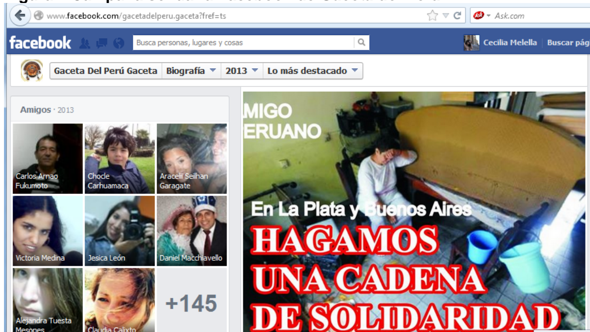
Figura 4 Campaña solidaria Facebook de Gaceta del Perú

Asimismo, señalamos que la Gaceta del Perú se relaciona más con ‘individuos’ y no tanto con otros medios. Por consiguiente, este periódico en Facebook sigue las normas establecidas por el periodismo en general y de la prensa gráfica en particular cuya misión es informar: no linkea , no comenta, sino que informa creando su propio contenido (aunque esto implique recortar los paratextos de las noticias levantadas de otros medios o editarlas, les pone el sello de la Gaceta del Perú ). También, difunde campañas solidarias como, por ejemplo, “Campaña de solidaridad para los inundados de La Plata” de abril de 2013, entre otras que reafirma su condición de medio de servicios (Diezhandino, 1993) (Figura 4).