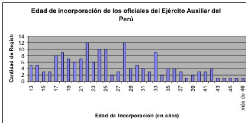
Gráfico N° 2: Edad de Incorporación de los Oficiales del Ejército Auxiliar del Perú 32

33 Si analizamos el grado militar con el que estos hombres fueron incorporados al Ejército Auxiliar del Perú también podemos constatar la juventud de los que se incorporaban. No conocemos el grado con el que se incorporaron nuestros 208 hombres, pero tenemos datos fehacientes para 166 oficiales. En este corpus podemos ver que 45 de nuestros oficiales se sumaron a las filas del ejército como tenientes y que 48 lo hicieron con el grado de capitán. La mayoría de los que accedieron al grado de teniente, 25 sobre 44, se encuentran entre los 18 y los 25 años, lo que se condice con los 22 años, el promedio de edad con el que se incorporaban los oficiales tanto del Interior como del Litoral. Algo similar ocurre con los capitanes, 24 de los 47 oficiales que se sumaron con este rango estaban entre los 21 y los 26 años. Que tengamos muchos hombres incorporados como tenientes responde a que es uno de los primeros escalafones de la estructura militar, por lo tanto, excepto aquellos que se incorporaron como cadetes, los más jóvenes solían arrancar su carrera militar por este grado. Tampoco asombra la gran cantidad de capitanes, ya que era el grado inmediatamente superior. Algunos de estos capitanes eran inclusive más jóvenes que sus colegas