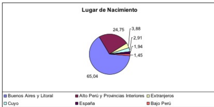
Gráfico N ° 1: Lugar de nacimiento de los oficiales del Ejército Auxiliar del Perú por regiones expresado en porcentaje

21 La fuerte presencia de hombres nacidos en Buenos Aires y el Litoral rioplatense no debe hacernos olvidar que este ejército tuvo una importante cantidad de oficiales nacidos en el interior y del Alto Perú dentro de su cuadro, así como también oficiales provenientes de las guerras europeas con los cuales se pretendió subsanar uno de los problemas más evidentes del Ejército Auxiliar del Perú, la falta de hombres con formación militar. Esta cuestión es la que abordaremos en el próximo apartado.