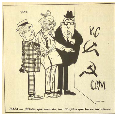
Primera Plana #149. 14/09/1965. Illia observa las pintadas comunistas, por Flax.

Balbín sostiene a un Illia más demacrado que nunca, que se arrastra por el piso preguntando por Onganía ( PP nº 170, marzo 1966, p. 7); Illia, sentado en un sillón, observa como le serruchan el piso agradecido porque no haya huelga de carpinteros ( PP nº 178, mayo 1966, p. 12). Sin embargo, ninguna de estas imágenes, que van mostrando en la línea clara de Palacio cada vez más arrugas, manchas y extremidades huesudas de un Presidente que comúnmente dibuja en una situación de descanso, utiliza la iconografía de la tortuga. Es presentado como “el hombre de la paloma”: el Presidente con una paloma en la cabeza, denotando su carácter manso y connotando carencia de inteligencia.