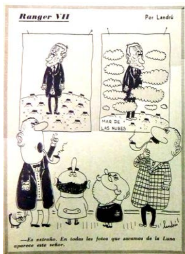
Primera Plana #092, 11/08/1964. Illia en la Luna por Landrú.

En los dibujos de Landrú, Illia es despistado y débil: es el muñeco de ventrílocuo de Ricardo Balbín ( PP nº 84, junio 1964, p. 11) 5 o un grupo de científicos lo encuentran en la luna ( PP nº 92, agosto 1964, p. 4)