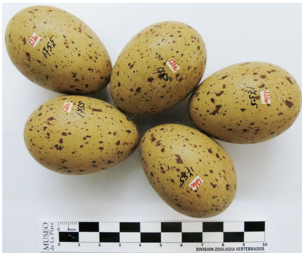
Figura 3. Nidada con cinco huevos de Pollona Común ( Gallinula galeata ) pertenecientes a la colección de huevos Ronald Runnacles del Museo de La Plata. El código escrito en rojo ("121a") representa la identificación de Ronald Runnacles en sus cuadernos de campo y el código escrito en negro ("1755") representa el número de ingreso a la colección oológica del Museo de La Plata.