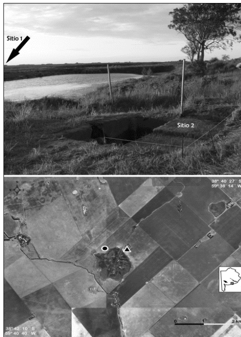
Figura 2: Localidad arqueológica El Guanaco, ubicación de los sitios con respecto al lago. Referencias: ○ – sitio 1; △- sitio 2.

La localidad arqueológica El Guanaco se encuentra en el área interserrana costera, en los alrededores de la laguna El Lucero, a 13 km de la costa atlántica (Figura 1:6). Esta laguna es un cuerpo de agua semi-permanente y dimensiones medianas, con una superficie aproximada de 35 ha. Allí se han relevado dos sitios arqueológicos y una importante colección de materiales líticos recuperados en superficie 2 . El Guanaco 1 se sitúa en la pendiente de una elevación suave al norte de la laguna. Hacia el este, a unos 500 metros de distancia, se encuentra El Guanaco 2 sobre una pequeña barranca (Figura 2). Las evidencias halladas en ambos sitios dan cuenta de la ocupación humana reiterada de este entorno lagunar a lo largo de todo el Holoceno.