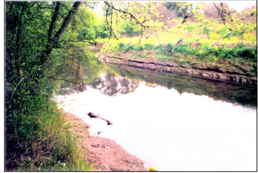
Figura 4. Río Matanza. Piletas Ezeiza.