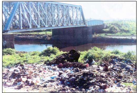
Figura 6. Río Matanza. Puente La Colorada.

mus sp. (Chironominae) Tanypus sp. y Coelotanypus sp. (Tanypodinae). La presencia de éstos comprende la cuenca alta y media del sistema, teniendo como límite máximo aguas arriba del arroyo El Rey; a partir de aquí y hasta la desembocadura no fueron registrados quironómidos en ninguna oportunidad. El género Chironomus sp. (Figura 2a) tiene una presencia casi constante, con una concentración bastante homogénea a lo largo de la cuenca alta y media, mostrándose como el más tolerante, teniendo su límite máximo a la altura de la desembocadura del arroyo Las Catalinas (Figura 5) en una zona de marcada reducción de organismos. El género Tanypus sp (Figura 2b) presenta altas concentraciones en determinadas estaciones de la cuenca alta y media del río, pero su presencia es menos constante tanto espacial como temporalmente, hallándose en una sola oportunidad a la altura del puente La Colorada (Figura 6), posiblemente de deriva de aguas arriba (no olvidemos el carácter de li-