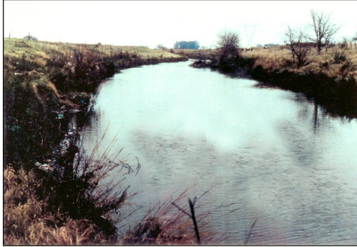
Figura 3. Río Matanza. Ruta 3.