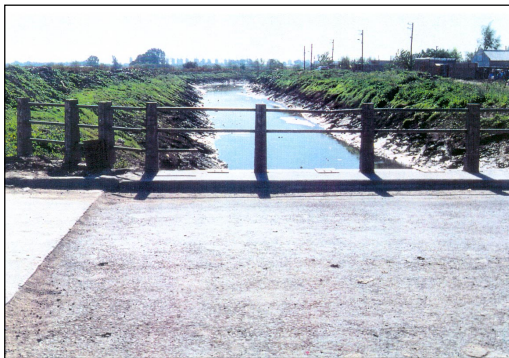
Figura 5. Arroyo Las Catalinas.