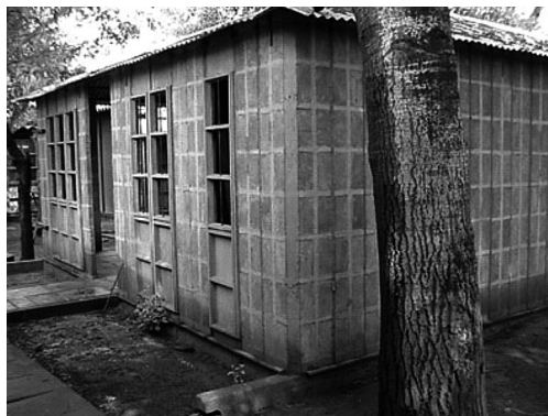
Foto 1. Prototipo de Vivienda Semilla

El revestimiento exterior, las divisiones interiores, los artefactos sanitarios, la aislación térmica del techo, la pintura y las instalaciones eléctrica, sanitaria, de agua, de gas y de evacuación cloacal las realiza el propietario posteriormente, de acuerdo con su gusto y posibilidades económicas.