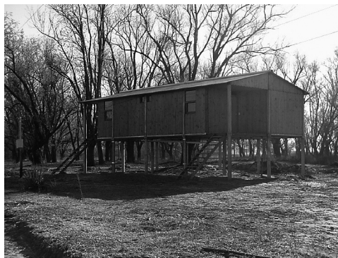
Foto 3. Sistema constructivo UMA