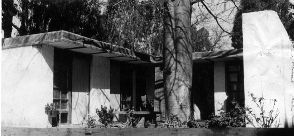
Foto 2. Prototipo de Vivienda Beno

- La Transmitancia Térmica Máxima (K) es de 0,90 \text{ W/m}^2\text{K} . Por ser este valor menor que la Transmitancia Térmica Máxima Admisible, verifica desde el punto de vista de confort higrotérmico, para la zona bioambiental III, según Norma IRAM 11605/96.