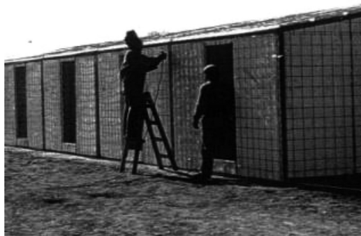
Foto 5. Viviendas con sistema FC2

- Cumple con la condición de habitabilidad higrotérmica que fija la Norma Iram 11605/96. La Transmitancia Térmica Máxima (K) es de 0,59 W/m 2 K. Por ser este valor menor que la Transmitancia Térmica Máxima Admisible, verifica desde el punto de vista de confort higrotérmico, para la zona bioambiental III. - La aislación acústica es similar al de viviendas construidas con bloques cerámicos huecos. Es una vivienda resistente, apta para distintas zonas sísmicas. Es durable e higiénica.