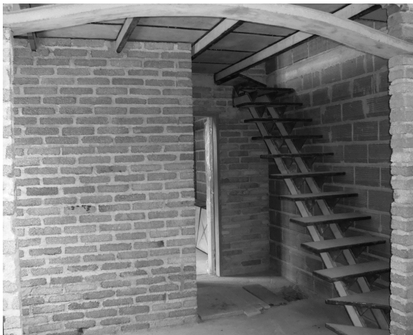
Foto 7. Interior de vivienda con ladrillos de PET reciclado