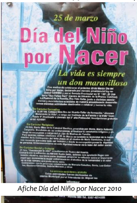
Afiche Día del Niño por Nacer 2010

En el año 1998, durante la presidencia de Carlos Saúl Menem, se estableció la fecha del