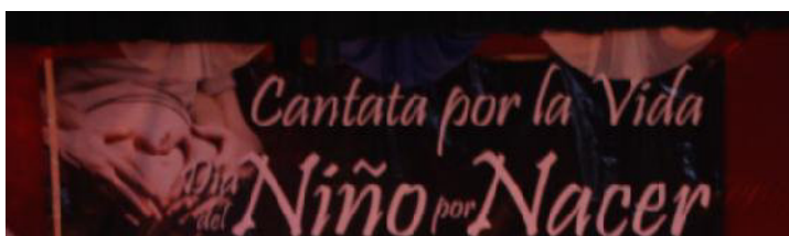
Cantata por la Vida 2011

El Decálogo de la vida, también recoge estas instancias de reducción a un útero de los cuerpos femeninos de los cuales depende la existencia del embrión-feto: “Las personas por nacer no son personas futuras, pues ya existen en el vientre materno. (Dalmacio Vélez Sarsfield,