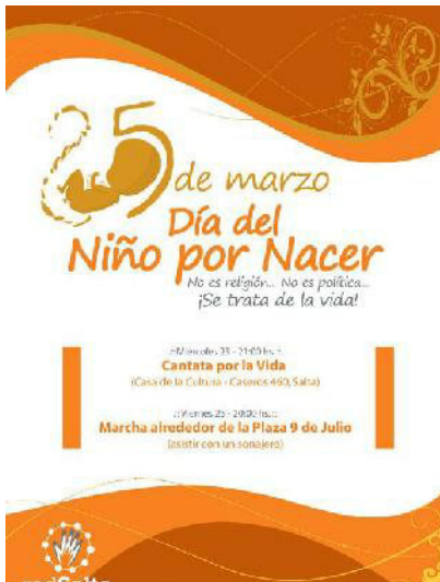
Afiche Marcha Marzo 2010

presente trabajo retomo las realizadas en los años de 2010 a 2012. Asimismo, me referiré a otros eventos fuera de esta fecha específica, que remiten al ‘niño por nacer’ y a este entramado de estrategias. Se enfatizan aquí aquellos aspectos que permiten analizar los sentidos de la vida que se entrecruzan en la figura del ‘niño por nacer’ y sus sentidos sociales.