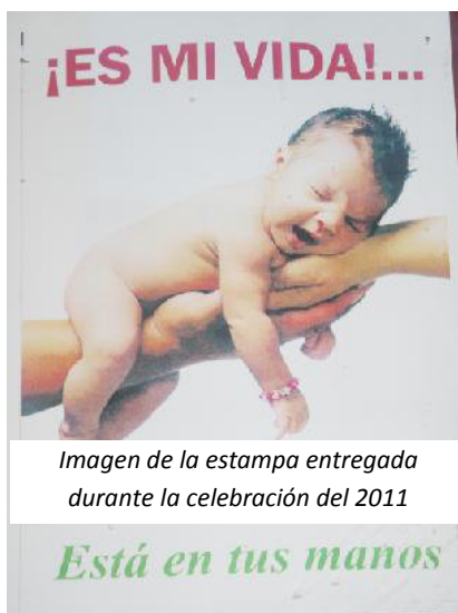
Imagen de la estampa entregada durante la celebración del 2011

Aquí retomo las lúcidas observaciones que realiza Rosalind Petchesky (1987) en torno de la importancia del uso de las imágenes fetales en relación a las políticas de la reproducción. La autora afirma, a partir de un análisis del conocido documental ‘El grito silencioso’, que aquí