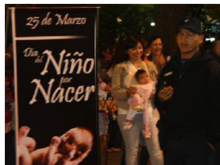
Imagen Marcha Marzo 2011

se cruzan dos textos, dos campos diferentes, el médico/visual y el moral/verbal, que ancla sus sentidos en lo cultural. Y donde el primero se presenta como argumento o base legítima para el segundo. La autora sostiene que: “cuando colocamos ‘El grito silencioso’ donde realmente pertenece, al campo de las representaciones culturales más que a la evidencia médica, vemos que éste inserta la imagen ecográfica del embarazo en un show de imágenes en movimiento” 78 (1987: 267); generando los siguientes efectos: “1) otorgando a esas imágenes una interfaz inmediata con el medio electrónico; 2) transformando la retórica antiaborto de una principalmente religiosa/mítica a una de corte médica/tecnológica; y 3) trayendo la imagen