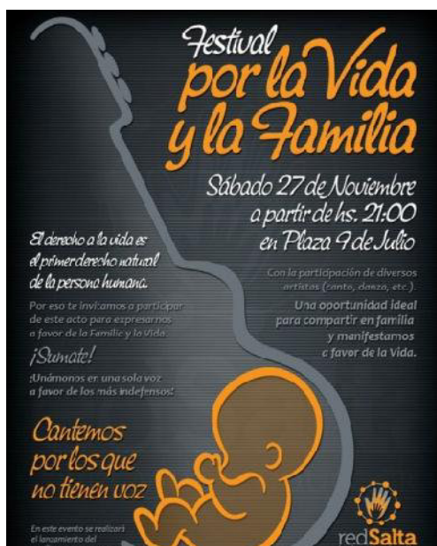
Festival por la Vida y la Familia. Noviembre 2011

De tal forma, se construye una vida en la que anclan diversos sentidos. Entre ellos, un sentido natural de la vida, que excede toda política e ideología y que emana naturalmente de la biología. A partir de un discurso médico-biológico, se va creando toda una trama discursiva en relación con los inicios y la constitución de la misma, que no depende en absoluto de instancias ajenas a su individualidad, sino que justamente se fundamenta en su carácter y sustancia biológica. Repetida al infinito, la frase de que la ‘vida inicia en el momento de la concepción’, posee un efecto de sentido que aunada a otras estrategias discursivas y (re)presentacionales, dota de base biológica y científica, y por tanto objetiva, a aquellas construcciones jurídicas y sagradas sobre el sentido de la vida. De esta manera, en el Decálogo de la Vida (Folletto, 2010), se muestra la recuperación de esta enunciación en diversas legislaciones o instituciones que la legitiman: “La vida de las personas comienza desde la concepción (Código Civil, artículo 70). La vida comienza en el preciso instante de la fecundación (Comisión Nacional de Ética Biomédica de Argentina, 30 de Setiembre de 1999). El derecho a la vida, desde el mismo momento de la concepción, es un derecho fundamental de la persona humana. (Consejo de Europa, 1979)”