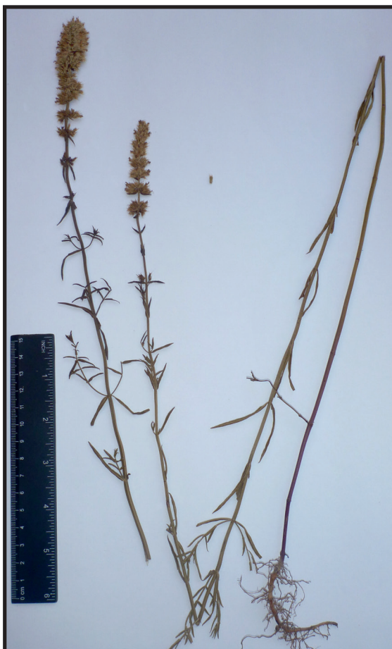
Figure 2. Material examined, Marchetti 806 (DTE), ca. 1 m in height; note the terminal congested inflorescences slightly interrupted at the base, relative size of the calyx and the narrow leaves up to 5 mm in width.

Nomenclatura. El epíteto específico de la especie tratada en la presente contribución aparece bajo la misma sigla de autor como "strictum" o "strictus": R. strictum (Benth.) Epling ó R. strictus (Benth.) Epling. El epíteto "strictum" es