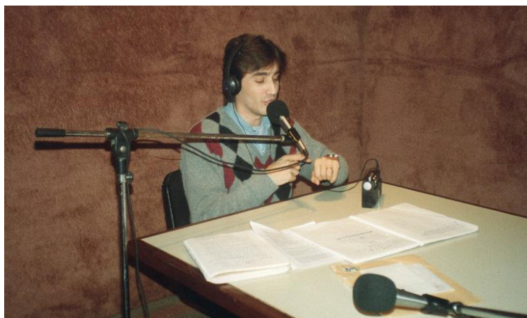
Figura 7. Dante Gebel conduciendo su programa radial “Línea Abierta, prohibido para mayores”, FM Cristiana, Munro (ca. 1991)