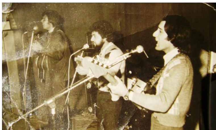
Figura 1. Recital de Profecías (ca. 1969)