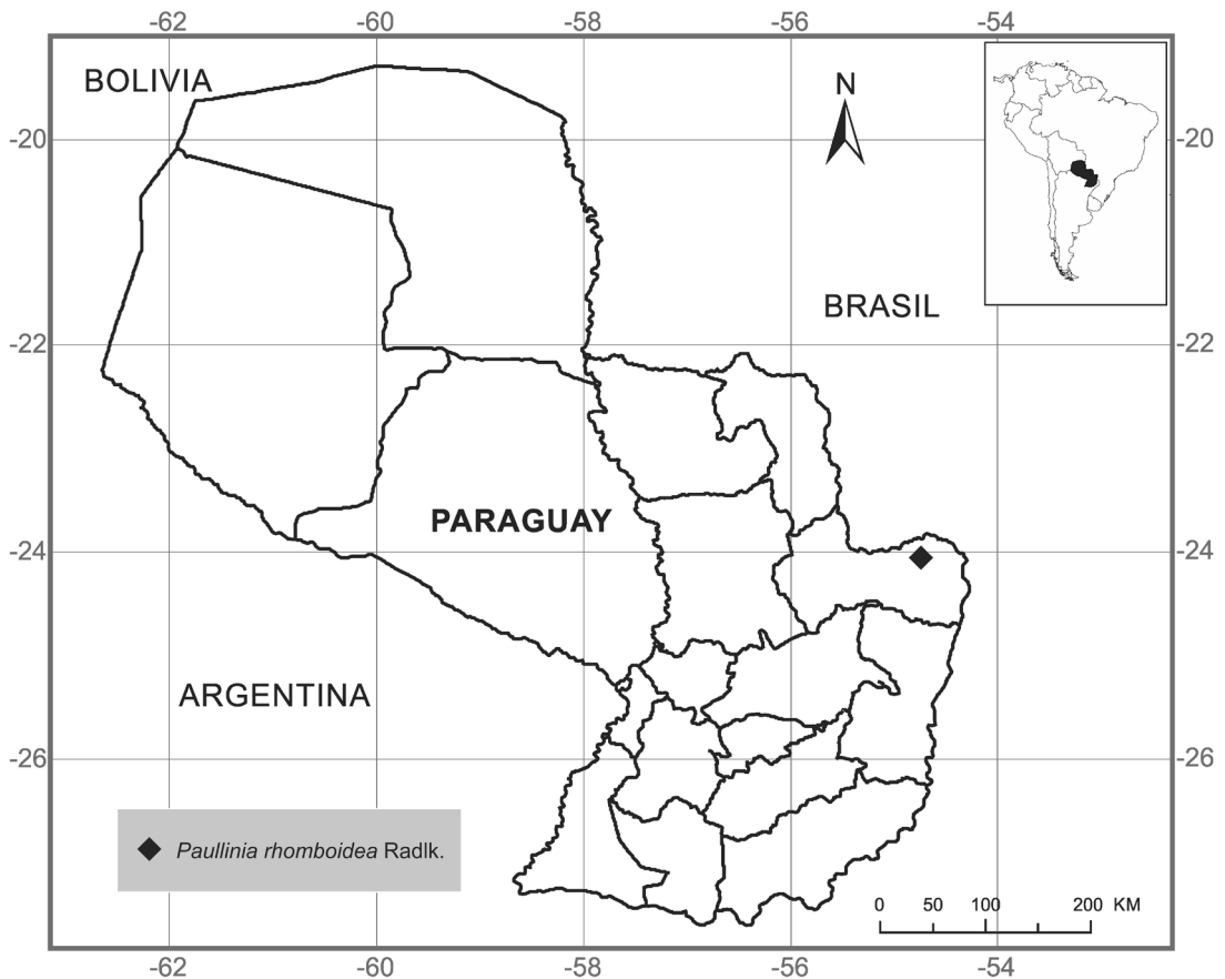
Fig. 3. Localización del registro de Paullinia rhomboidea en Paraguay.

Material adicional seleccionado: BRASIL. Distrito Federal: Brasilia, Riacho Fundo, estr. Aeroporto, 12-VIII-1980, Fiedler 021 (CTES, MBM). Minas Gerais: Uberlândia, Capim Branco I, 23-VII-2007, Rosa & Araújo 715 (CTES, HUFU). Paraná: Sapopema, Salto das Orquídeas, 22-I-1998, Medri et al. s. n. (CTES, FUEL 23341). Pernambuco: Brejo da Madre de Deus, propriedade Bituri, n. v. "cipó pau", 16-X-1980, Maia Filho 20 (CTES, IPA). São Paulo: Jundiaí, Reserva