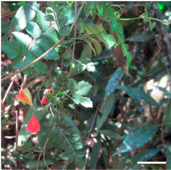
Fig. 2. Aspecto de la planta coleccionada en Paraguay. Escala: 2 cm.

Obs.: Los caracteres florales consignados en la descripción se tomaron sobre la base del material adicional seleccionado.