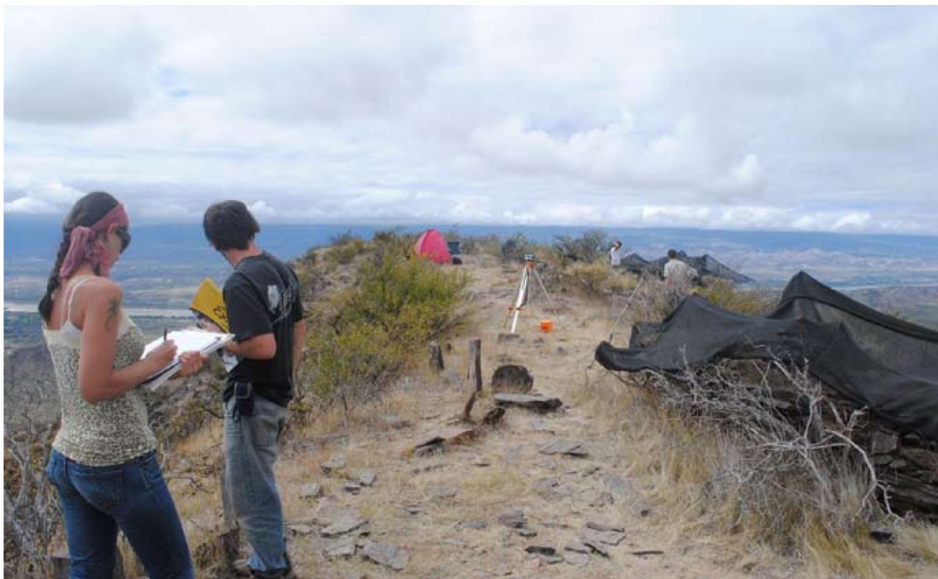
Sitio arqueológico El Carmen de la cultura Santa María, sierra del Cajón, Tucumán.

Además de abordar el pasado, la investigación arqueológica se interesa por la dimensión material de la vida presente. Los etnoarqueólogos trajeron innovaciones con su trabajo en comunidades actuales, por ejemplo, de cazadores recolectores de las selvas tropicales o de pastores del altiplano andino. Estudiaron in situ diversas prácticas de esos grupos, registraron sus productos materiales y miraron con una luz distinta de las sociedades contemporáneas. Asimismo, tomaron interés por los objetos de la vida cotidiana actual, como automóviles, envases, aviones, etcétera. Colocan el foco, por lo general, en la práctica antes que en el discurso, y por considerar