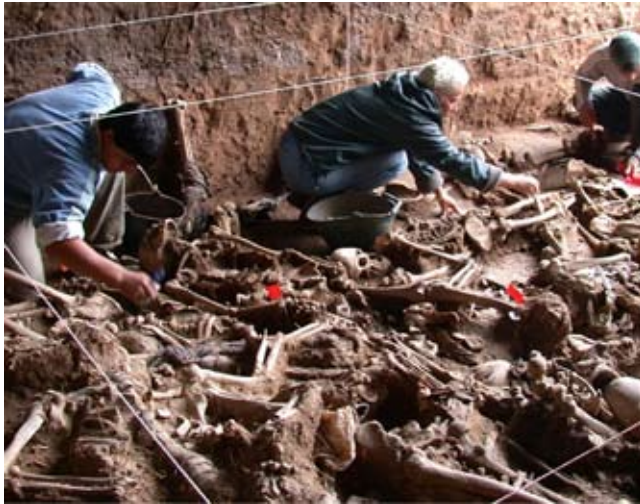
Excavación del Equipo Argentino de Antropología Forense de una fosa común en el cementerio de San Vicente, Córdoba, 2003, que contenía los restos de decenas de 'desaparecidos' durante la dictadura militar de 1976-1983.

lo inconsciente o no visible antes que lo declamado. Los estudios sobre la capacidad de la arquitectura de condicionar las acciones de los actores sociales constituyen quizá el mejor ejemplo de esta orientación.