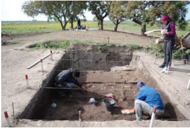
Sitio arqueológico Los tres cerros, en territorio de Entre Ríos del delta superior del Paraná a la altura de Victoria. Foto Mariano Bonomo, 2012.

valdo Menghin (1888-1973), y se consolidó con el impulso renovador de Alberto Rex González (1918-2012). En la actualidad es una disciplina científica con teorías y métodos originales, en la que numerosos arqueólogos profesionales trabajan diseminados por todo el país: solo en el sistema del Conicet revistan 137 investigadores y 128 becarios dedicados de tiempo completo a la investigación arqueológica.