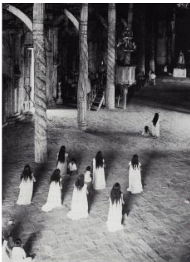
Imagen 12. Hans Ertl. “Mujeres rezando en la iglesia de San Rafael”. 1951 Archivo fotográfico de Chiquitos

El hecho de ser un “anexo” del patrimonio arquitectónico no desmerece el valor de las imágenes, sino que indica la intencionalidad con la que fueron obtenidas y el contexto en que la producción se realiza. Incluso, aquellas en las que el interés fue la documentación del patrimonio arquitectónico y artístico pero donde también se hace presente el indígena, contribuyen a consolidar el imaginario evangelizador. Una imagen sobresaliente en tal sentido es la tomada por Ertl de un grupo de mujeres orando en la Iglesia de San Rafael (Imagen 12). La toma realizada desde un punto alto, connota el control espacial y la presencia de un grupo de mujeres arrodilladas que son vistas de espaldas. Todo ello en el contexto de un espacio austero pero con una fuerte presencia de símbolos, sintetizan la religiosidad chiquitana y la vivencia de los valores cristianos, convirtiendo a la imagen en un legítimo testimonio de la evangelización lograda.