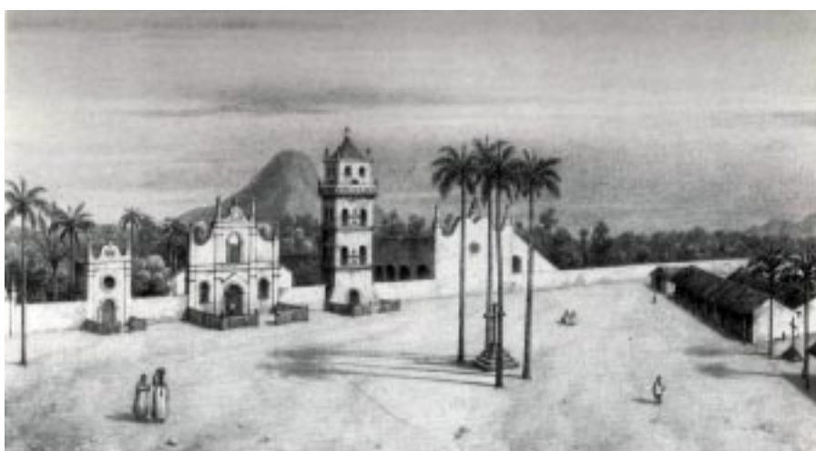
Imagen 2. Alcides D’Orbigny. “Vista de la plaza de San José, Misiones Jesuíticas, en la Provincia de Chiquitos (Bolivia)”

y las fiestas religiosas. De hecho, “ las plazas contaban con los elementos que permitían el sentido de sacralización de las actividades cotidianas en concordancia con las modalidades de uso y los valores simbólicos que presidían el proyecto misionero. ” 15 Pero D’Orbigny también enmarca la plaza en un escenario natural más amplio, que vincula al concepto que tanto se explotará en la actualidad: aquel que hace referencia a la “ esplendorosa Chiquitanía ”. En la vista de la plaza de la Misión San José, un segundo plano nos revela un paraíso natural extraordinario; a la vez que a través de la utilización de una línea de horizonte medio logra remarcar la noción de inconmensurabilidad. Naturaleza exuberante y edificios paradigmáticos del arte barroco misionero son algunos de los ejes de su discurso. Entorno natural y construido con el que se mimetiza al indígena. (Imagen 2).