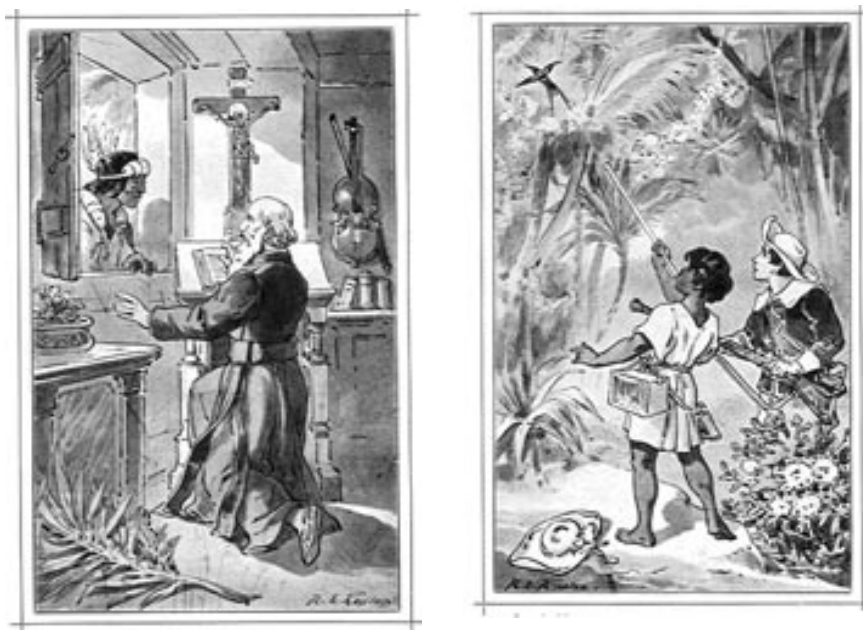
Imágenes 7 y 8. Josef Spillmann. Tapa y láminas interiores de “La fiesta de Corpus en Chiquitos”, Friburgo, ed. Herder, 1901.

aparece como la figura testimonial por excelencia de la evangelización lograda. Su presencia certifica el “haber estado allí” y otorga visibilidad a una idea que los jesuitas remarcaron insistentemente en sus discursos: el estar con y entre los indígenas, “protegiéndolos y educándolos”. (Imágenes 7 y 8)