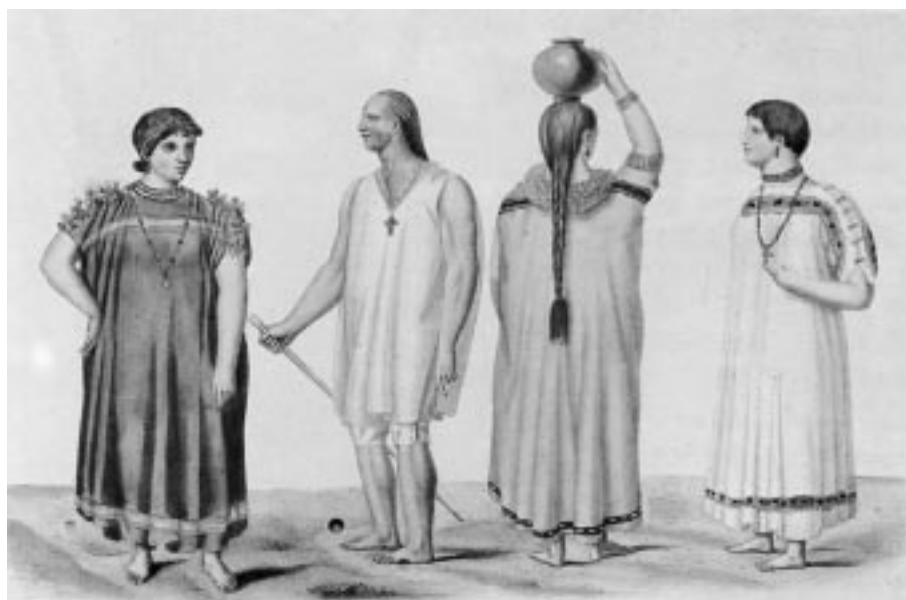
Imagen 1. Alcides D’Orbigny. “Indias e indios de la Provincia de Chiquitos” En: Viaje a la América Meridional

ello como objetiva: los cuerpos y rostros pierden identidad para convertirse en tipos representativos de un universo y la imagen se exime de una valoración de tipo social o moral de los retratados. El interés se centra en la visibilización de las vestimentas, accesorios y algunos objetos que son también descriptos en el texto escrito. Ellos se convertirían en actos de iconicidad, en señas de referencia étnica. Los índices del “chiquitano” en los dibujos de D’Orbigny son el tipoy con cintas de colores bordadas en las mujeres y los calzones de algodón para los hombres, tal como expresaba en su narrativa. La diferencia del largo de la cabellera también se expresa en el discurso escrito y visual, lo cual responde a la condición de soltero o casado del hombre. Entre los accesorios, las mujeres sostienen tinajas y los hombres una varilla, a la vez que ambos llevan colgados una cruz en el pecho. El templo ha sido visibilizado a través de esta cruz, que constituye el símbolo visual más inequívoco del chiquitano evangelizado. (Imagen 1)