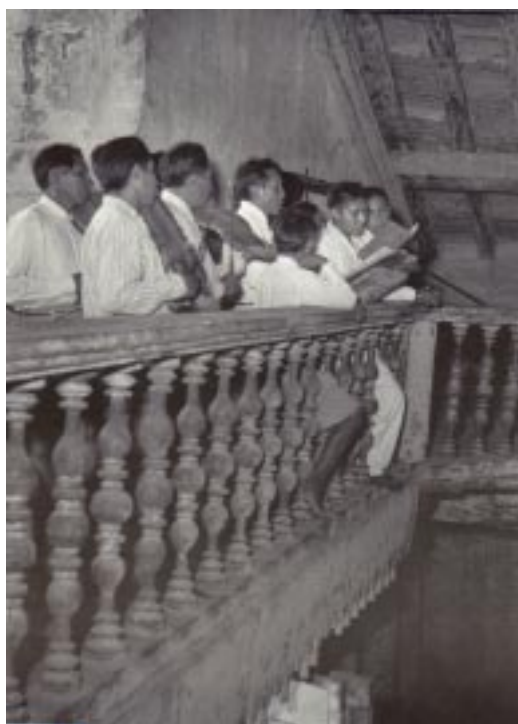
Imagen 11. Hans Ertl. “San Rafael. Los solfas cantando en latín, leyendo la música escrita, en una ceremonia sin sacerdote”. 1951 Archivo fotográfico de Chiquitos

La sección “Los hombres” de este archivo consolida la imagen del chiquitano evangelizado: las fotos refieren a las fiestas patronales, retratos de indígenas portando imágenes religiosas o tocando instrumentos musicales (recordemos que la música fue uno de los elementos centrales en la evangelización jesuítica, y de gran importancia en la Chiquitanía), imágenes procesionales, conjuntos musicales ejecutando piezas en la iglesia o posando para el fotógrafo con sus instrumentos. Pero también se encuentran retratos y “escenas étnicas” 35 ; estas últimas ocupan un lugar pequeño pero de gran importancia y se refieren principalmente a actividades de mujeres indígenas (aguateras transportando tinajas, otras moliendo maíz o tejiendo en telar, e incluso en máquinas de coser), pero también hombres realizando esterillas, pescando con red, descortezando troncos, etc. El trabajo de los hombres en el campo, tanto en ganadería como en agricultura o abriendo picadas en la frontera, en el contexto de una naturaleza prodigiosa, completan a grandes rasgos esta colección. En su conjunto, estas imágenes constituyen una reaparición del indígena chiquitano en su contexto, con una focalización especial en su herencia misionera y su cotidianeidad.