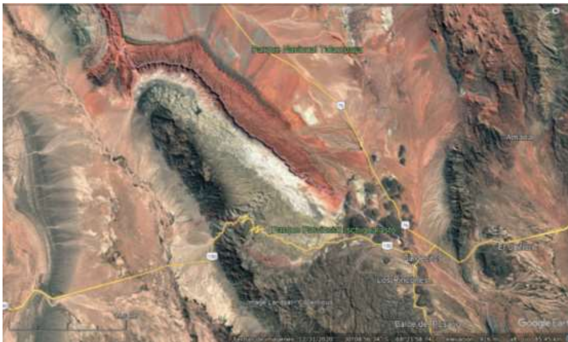
Figura 3: Foto satelital entre Ischigualasto y Talampaya, capturada desde Google Earth.

A ello se le suman aspectos jurisdiccionales como la de parques nacionales y provinciales en los que se establecen límites legales que regulan el uso del suelo y las prácticas culturales. Como el caso de Talampaya e Ischigualasto (Figura 3). Estos límites administrativos se encuentran en estrecha relación a la gestión territorial y la gobernanza, generando desafíos para la planificación y conservación del patrimonio cultural y natural.