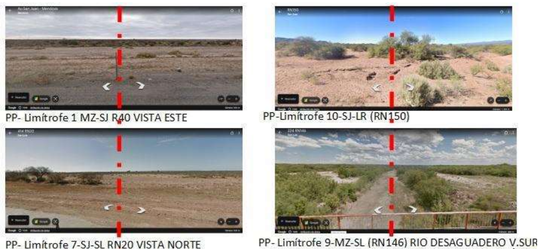
Figura 6: Vistas de las continuidades de las características del paisaje en los límites administrativos interprovinciales (Línea de trazo y punto roja), capturadas desde Google Earth Street View

De ellas en las características materiales del paisaje que traspasan los límites administrativos interprovinciales (Figura 6), se observan áreas de alta similitud, las que paulatinamente van distorsionándose para dar lugar a la manifestación de diferenciaciones producto de un aspecto relacional sistémico que conjuga la geomorfología, suelo, clima y la flora, fauna y funga y los aspectos humanos producto de la interacción con ellos.