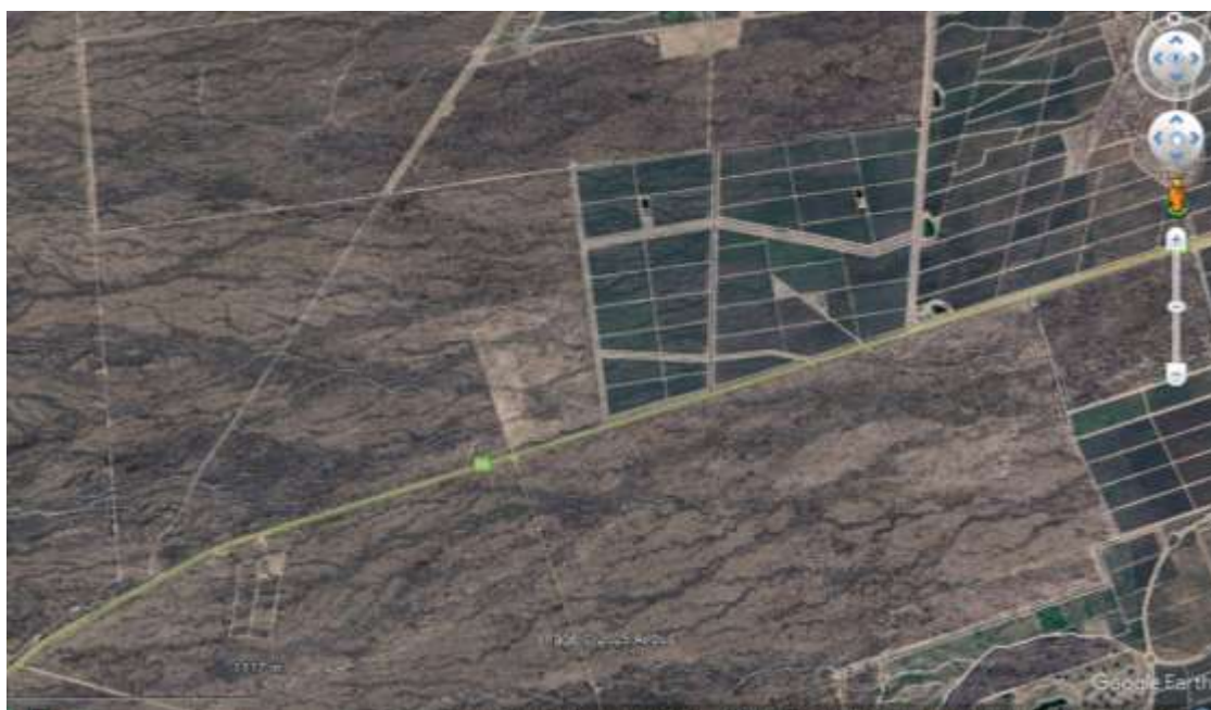
Figura 5 a y b: Foto satelital y Vista del límite de los cultivos de viña y secano en Ruta 86 de Ugarteche, capturadas desde Google Earth y Google Earth Street View.

39 permanente tensión y dinamismo, los cuales varían de acuerdo a los marcos contextuales sociales, ideológicos, políticos y económicos. Un ejemplo de esto, son los límites entre los oasis y el secano de las provincias, como se observa en el caso del límite generado por el fin de los cultivos de viñedos con el secano del departamento de Ugarteche Luján de Cuyo Mendoza (Figura 5).