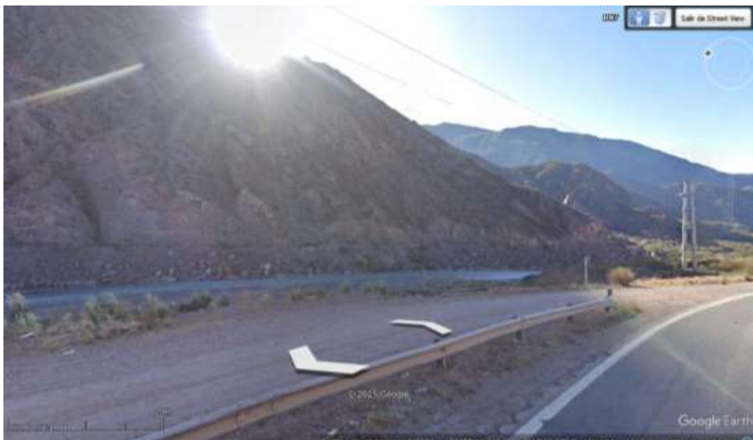
Figura 2: Vista del Río Mendoza desde la Ruta N°7.

-Límites físicos o naturales: son aquellos definidos por características geomorfológicas como montañas, llanuras, ríos, montes, sierras y bolsones, los cuales se encuentran en estrecha relación a los límites vinculados a las características climáticas. Algunos ejemplos incluyen la Cordillera de los Andes, la Precordillera, las Sierras Pampeanas y los ríos como el Mendoza (Figura 2), San Juan y Bermejo. Estas áreas presentan transiciones climáticas entre semiárido a árido, solo por mencionar algunos.