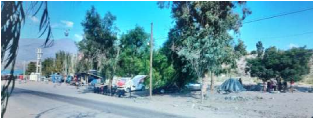
Figura 4: Foto del límite del Río Mendoza y el uso espontáneo recreativo a la altura de villa de Potrerillos.

-Límites socioculturales y perceptuales: se refieren a la manera en que las comunidades locales perciben y organizan el espacio, entendiendo el paisaje como una producción social. El espacio no es solo un contenedor físico, sino un escenario donde se configuran relaciones sociales, conflictos y significados culturales. A continuación mostramos un uso espontáneo, recreativo y sostenido en el tiempo por parte de la sociedad de Mendoza en las orillas de los ríos de alta montaña, lo que ha generado una resignificación del uso del suelo que se integra a las funciones residenciales y comerciales del Valle de Potrerillos (Figura 4). Estos límites son dinámicos y se encuentran en estrecha relación a los procesos de apropiación y resignificación del territorio.