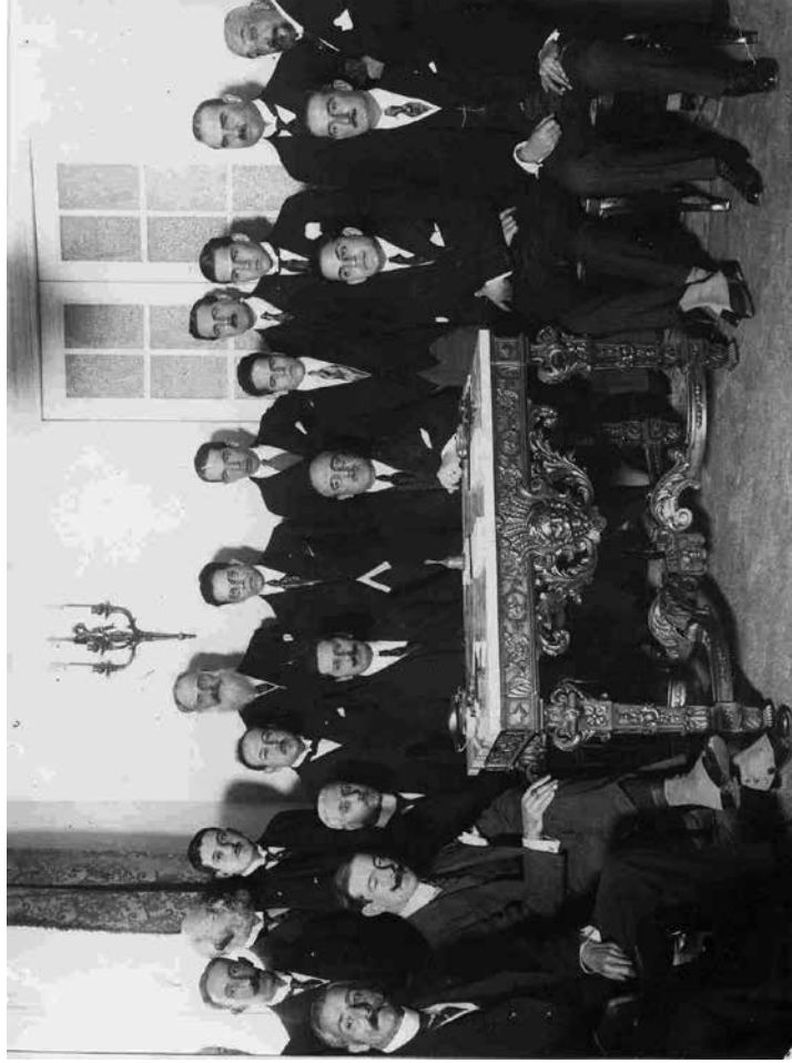
La diplomacia mexicana se solidarizó con diferentes líderes progresistas latinoamericanos que buscaron refugio en México, un ejemplo de esto es el papel que desempeñó a partir de la Revolución armada de 1910.