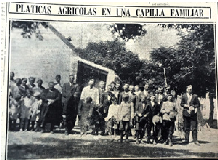
Figura 2. Registro de la visita de técnicos del departamento a una capilla de aldea brasilera 109