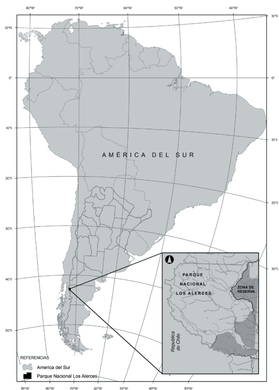
Fig. 1. Ubicación del PN Los Alerces y el área de Reserva involucrada en el estudio.

El centro poblacional más cercano es la ciudad de Esquel, distante a 50 km del parque. Actualmente