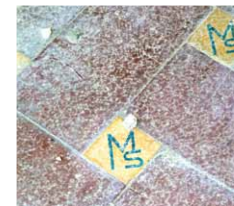
Mosaicos con la inscripción de las iniciales de Myriam Stefford