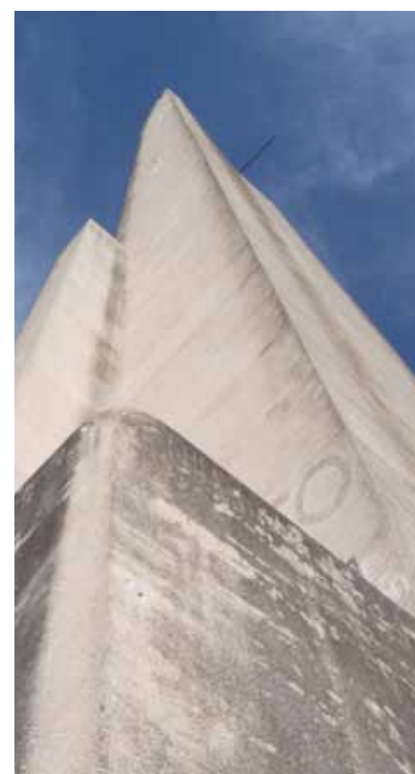
Vista de la esquina noroeste del monumento.