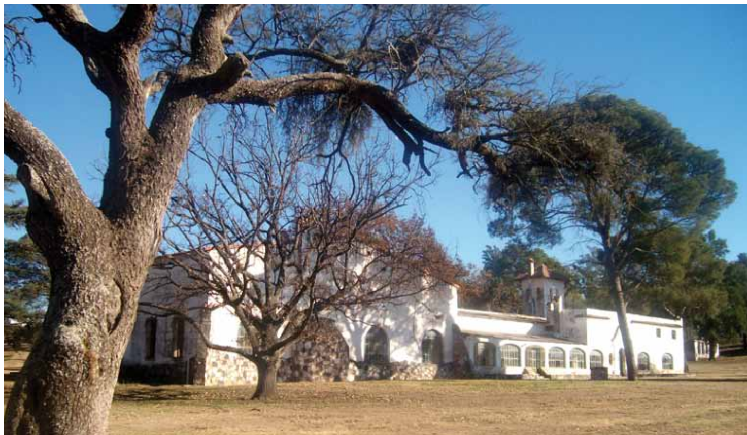
Estancia "Los Cerrillos" en la actualidad.