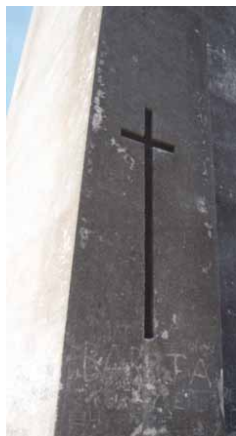
Sector sur del monumento con la cruz ahuecada que ilumina el interior.