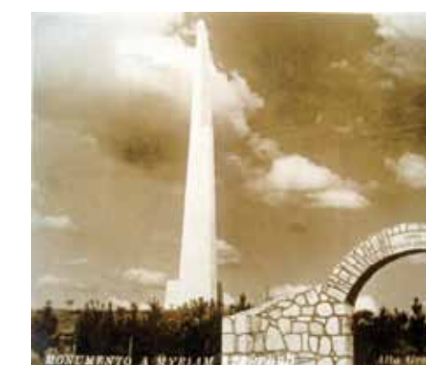
Antigua postal con el desaparecido ingreso al monumento