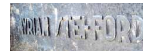
Inscripción de la puerta de ingreso

sería el más importante del acto, el diario no mencionó nada. Lo que sí, acompañó a Raúl Barón Biza el gobernador Amadeo Sabattini (su futuro suegro), repartiéndose víveres y ropa entre los pobres. La confusión periodística, la noticia mediática y la información amarilla, despertó todo tipo de especulaciones con respecto al monumento, como que Barón Biza lo había levantado porque detrás de la muerte de la aviadora se ocultaba un crimen pasional. Ni hablar de la búsqueda de las fastuosas joyas y los posteriores saqueos que se produjeron varios años después. Asimismo, el monumento también despertó ridículos comentarios como que había sido levantado por el demonio. Llegó el momento de la inauguración el 30 de agosto de 1936, y una nueva fiesta popular al pomposo estilo de Barón Biza. Asado criollo para todos los humildes que