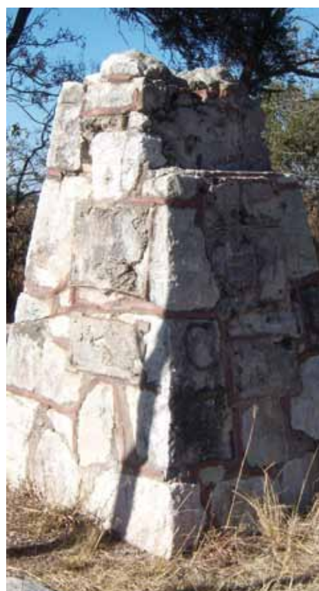
Monolito que contenía parte del motor del avión "Chingolo II" en la actualidad y por la época de erección con sus placas conmemorativas.