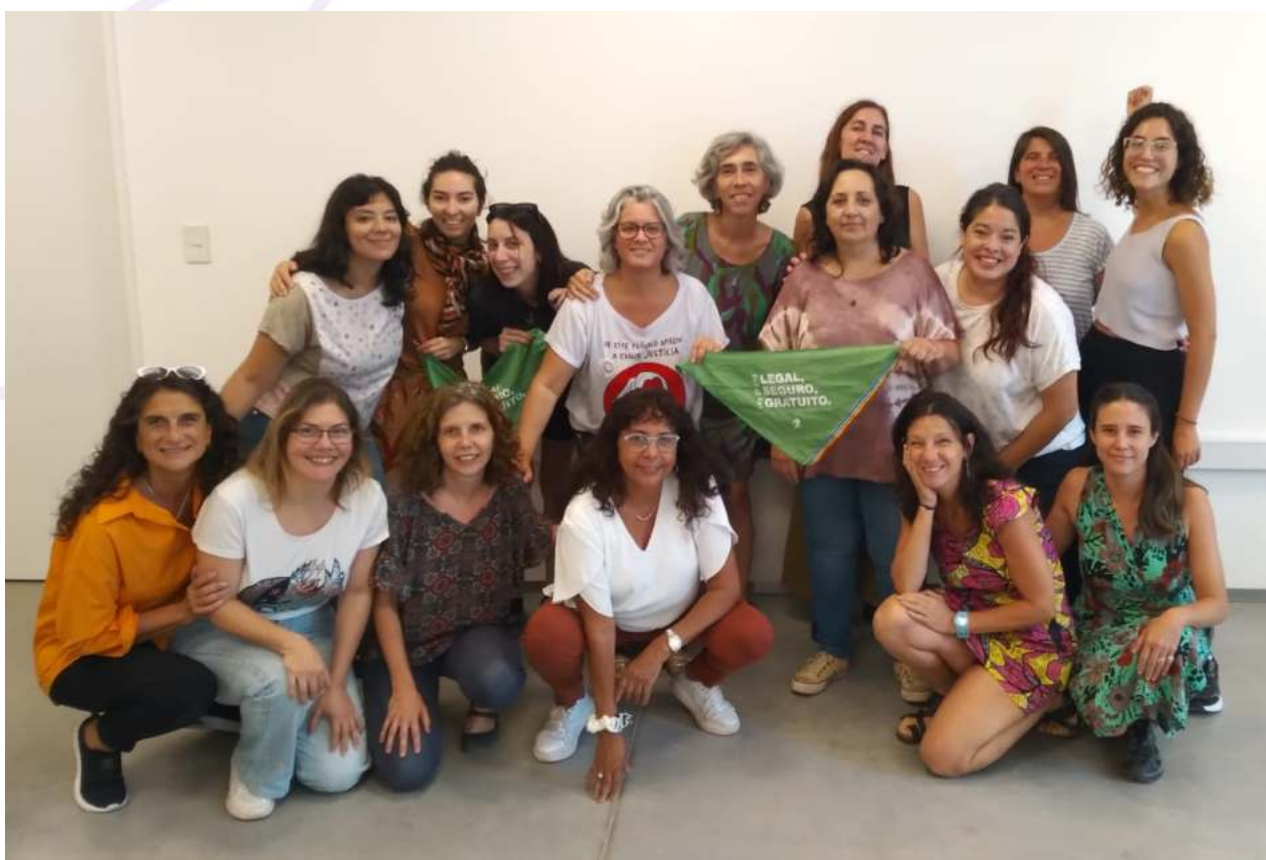
3er Encuentro de Equipo e intercambio (UNSAM) San Martín. Buenos Aires. (8 de Marzo 2024)