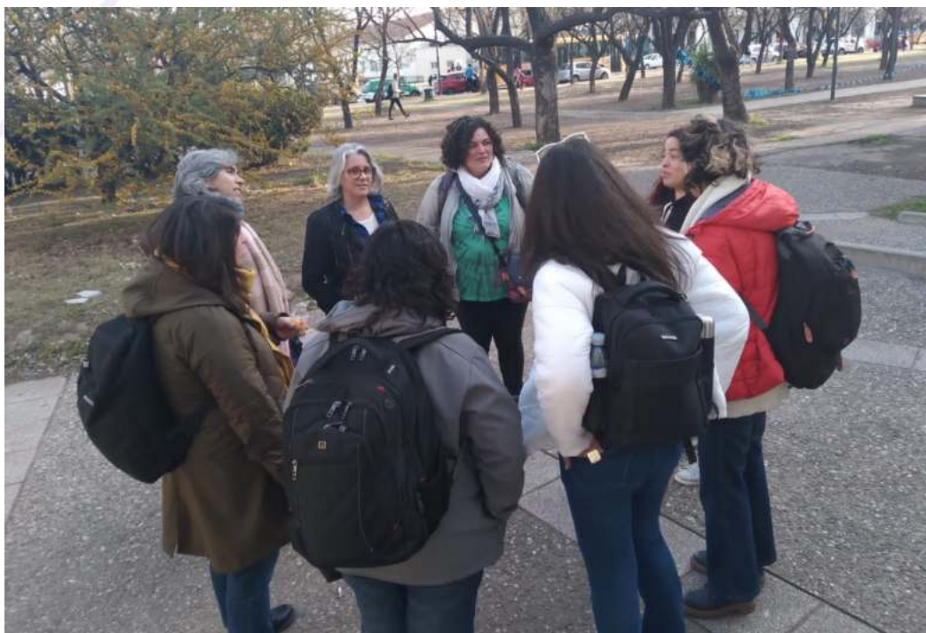
Salida en Parque Córdoba, encuentro de integración del Equipo (fines de 2023)