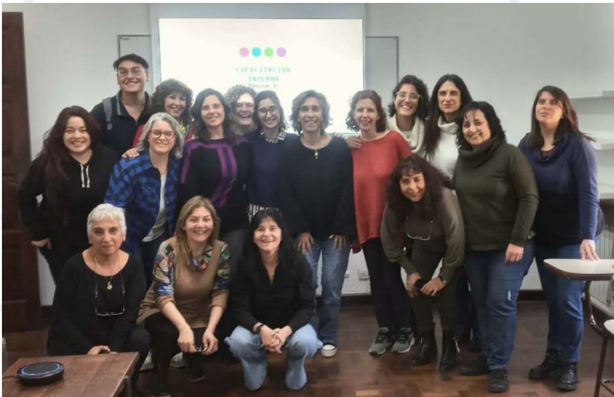
2do Encuentro de Equipo e intercambio y capacitación (UNC) Córdoba. Argentina (2023)