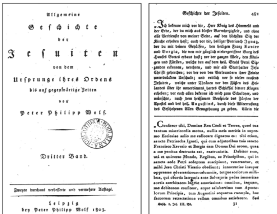
Portada y página donde comienza la transcripción de la Retracción en latín que hace Wolf en una edición de sulibro de 1803.

Al desconfiado alemán siguieron otros escritores como Anche Liévin-Bonaventure Proyart 16 quien en 1800 también afirmó ser un documento falso. Aunque otros, como Jean-François Georgel dieron como real esta Retracción en su obra publicada en París siete años después 17 . También, otro escritor francés, Jacques-Maximilien Benjamin de Saint-Victor es categórico en afirmar en 1827 18 que la autenticidad está fuera de toda duda. Incluso la versión gala de 1889, señala que la Retracción fue publicada por el periódico “ O Católico ” de Braga en el número 2 del 10 de marzo de 1853. De tal modo que ese manuscrito “secreto” en realidad tenía una amplia difusión en Europa antes que los jesuitas lo hicieran público a través del P. Eugenio Labarta.