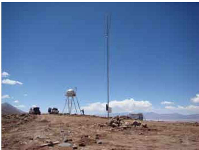
Figura 3. Torre del telescopio, estación meteorológica, refugio y paneles solares (izquierda). Instrumento MASS-DIMM alojado en el domo de la torre (derecha).

El seeing es uno de los parámetros más importantes para caracterizar un sitio destinado a un instrumento astronómico óptico. Nos da una medida de la calidad y resolución de las imágenes que se pueden obtener en el lugar. Se mide en segundos de arco y es mejor cuanto menor es su valor. Los valores de seeing varían desde los 0,3 segundos de arco, como excepcionalmente buenos, en muy pocos sitios, hasta valores por encima de 2 segundos de arco, lo cual ya no se considera aceptable para los modernos telescopios. En Macón más del 50% de los valores de seeing registrados son inferiores a un segundo de arco (0,85 segundos es el valor más probable).