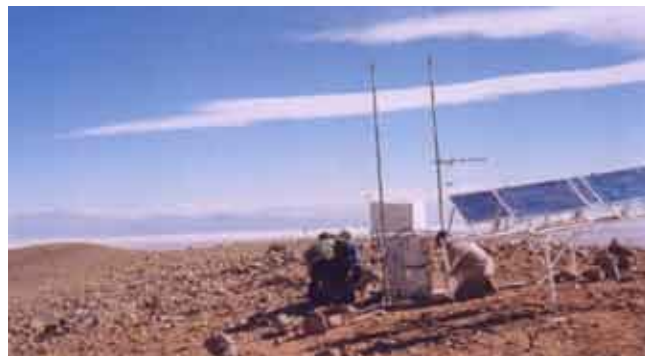
Figura 4. Instalación del instrumento Tipper en la cordillera de Macón, a 4610 metros de altura sobre el nivel del mar. Su propósito es medir la permeabilidad de la atmósfera al pasaje de microondas astronómicas de longitudes milimétricas y submilimétricas.

Estos proyectos han despertado gran interés tanto en los habitantes del lugar como en diferentes esferas del gobierno salteño y en la colectividad astronómica nacio-