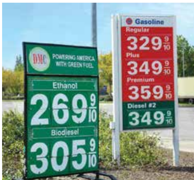
Aviso de una estación de servicio de Sacramento, California, que ofrece explícitamente bioetanol y biodiésel. Los precios están en centavos de dólar por galón (3,8 litros). Adviértase que en ese momento (mayo de 2010) el etanol se vendía allí 18% más barato que la nafta común.

la cual materia orgánica sometida a altas temperaturas se descompone y genera una mezcla de carbón y alquitrán.