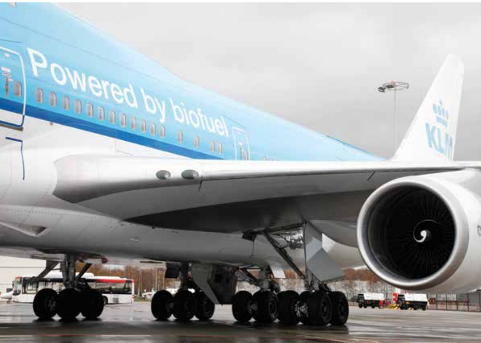
Los biocombustibles pueden sustituir a los combustibles fósiles sin mayores restricciones, como lo muestra este Jumbo en Holanda.

Existen, sin embargo, situaciones en que para ciertos cultivos pueden complementarse el uso alimentario y la utilización como materia prima de biocombustibles. Así, si se produce biodiésel a partir de soja, se aprovecha el aceite del poroto y no su proteína. En esta, precisamente, reside el mayor valor alimenticio de la soja, cuyo aceite entra poco en la alimentación humana y debe eliminarse