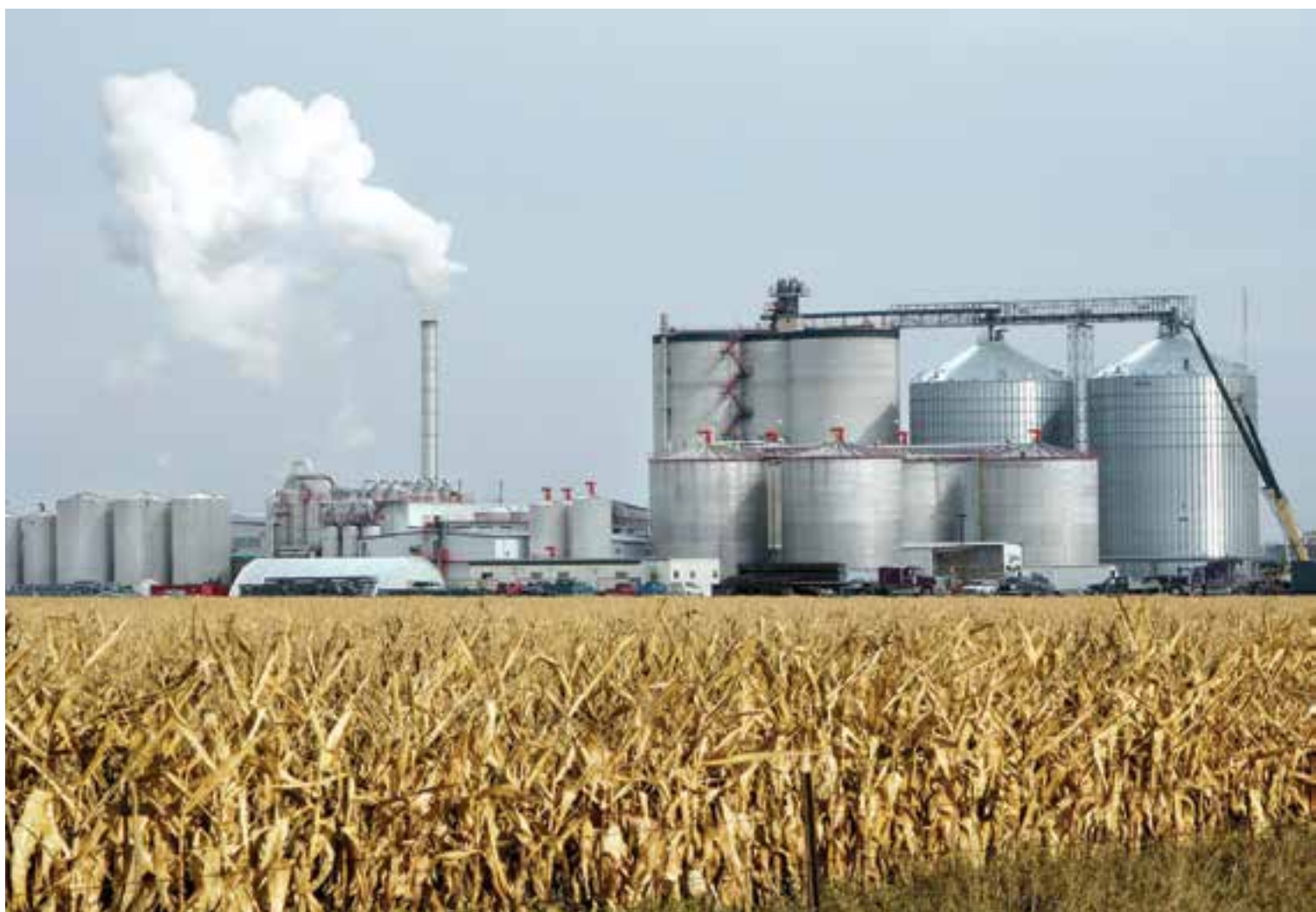
Planta de producción de biocombustibles en el medio oeste norteamericano. En primer plano, maíz que le sirve de materia prima.

Hay varias formas de producir biocombustibles de segunda generación, de las cuales la vía bioquímica y la termoquímica son las más conocidas. La primera emplea microorganismos para reducir a azúcares simples las complejas cadenas químicas de las moléculas de celulosa, y luego transforma los azúcares en biocombustible. La forma termoquímica se vale de alta presión y temperatura para pasar de una amplia variedad de tipos de biomasa a combustibles. Un camino posible es obtener gas de síntesis , una mezcla de monóxido de carbono (CO), dióxido de carbono (CO 2 ) e hidrógeno (H 2 ). Este gas se utiliza luego para producir energía en forma de calor. La otra forma termoquímica de conversión es la pirólisis , una reacción química que se lleva a cabo en ausencia de oxígeno y por