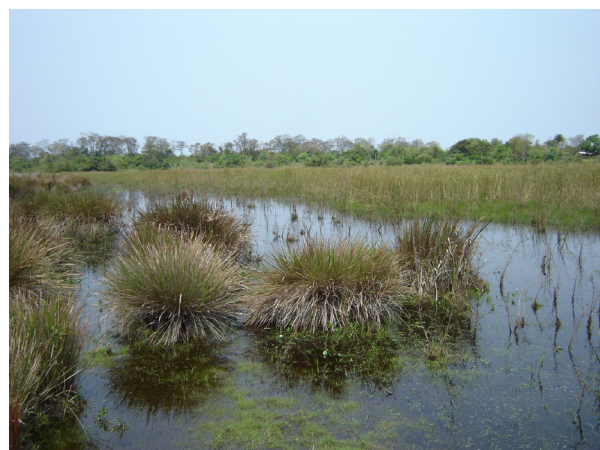
Figura 2. Hábitat de Rhinella azarai en la Reserva Natural Provincial Isla Apipé Grande (Corrientes, Argentina).

Con respecto a la dieta, el 91% ( n=20 ) de los estómagos analizados presentaron contenido. Se encontró un total de 180 presas entre las que se identificaron himenópteros, coleópteros y hemípteros. El análisis del contenido digestivo se resume en la Tabla 1. En cuanto a la jerarquización de la dieta, Hymenoptera (todos pertenecientes a la familia Formicidae) fue categorizada como fundamental, Coleoptera (Carabidae, Crysomelidae, Curculionidae, Elateridae, Scarabeidae y otros no identificados) como accesorio y Hemiptera (Heteroptera) como accidental. Esta tendencia al consumo de hormigas coincide con lo observado en otras especies de Rhinella del grupo granulosa del nordeste argentino, tales como R. bergi , R. major y R. fernandezae (Duré et al. , 2009). Esto podría deberse a la abundancia de dichos insectos en los ambientes y a su agregación en los mismos, constituyendo una presa de fácil captura que compensa el bajo rendimiento energético (Quatrini et al. , 2001). Además es conocida la relación existente entre la mirmecofagia y la producción de