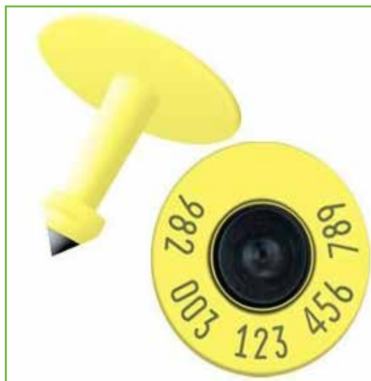
Figura 1: Caravana RFID, o electrónica.

computadora portátil o smartphone. En este punto, ya se empiezan a materializar las ventajas de la tecnología aplicada, ya que la información se almacena digitalmente, evitando el uso de planillas y todo el error humano involuntario asociado a ellas como ser: la escritura con errores caligráficos, el "cantado" erróneo de caravanas, y los errores de tipeo cuando se pasan las planillas a la computadora, que además no suele ser inmediata.