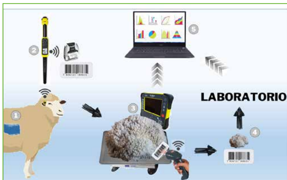
Figura 2: Proceso de trazabilidad de vellones y muestreo de lana para enviar a analizar.