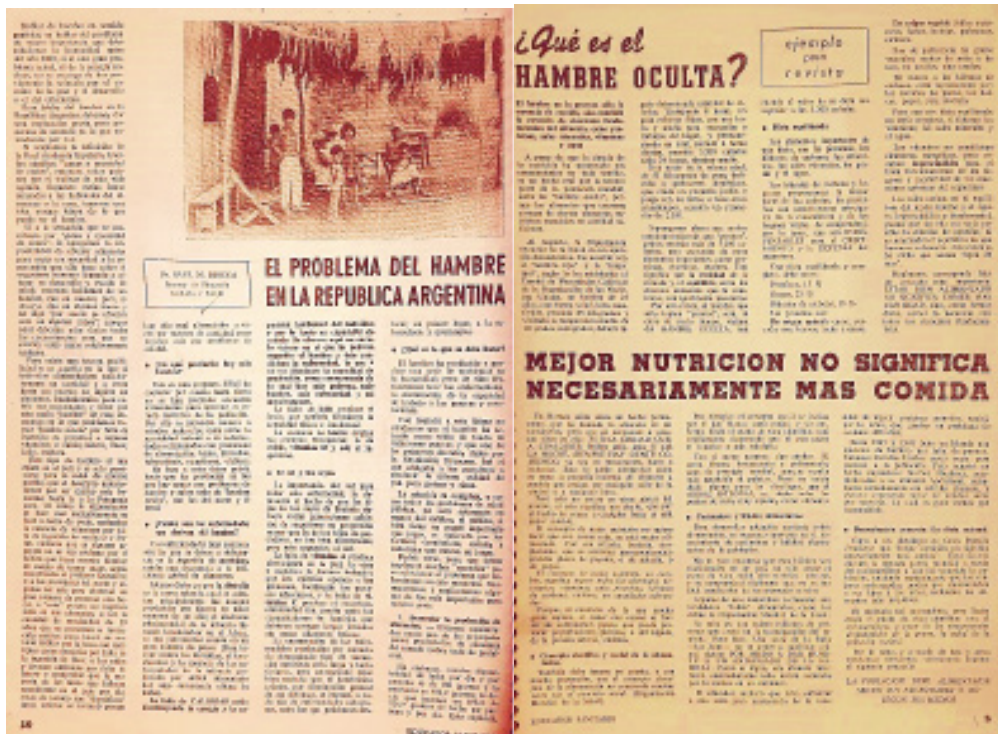
Figura 1. El problema del “hambre oculta” en la Argentina Fuente: (20, p. 10;21;22).