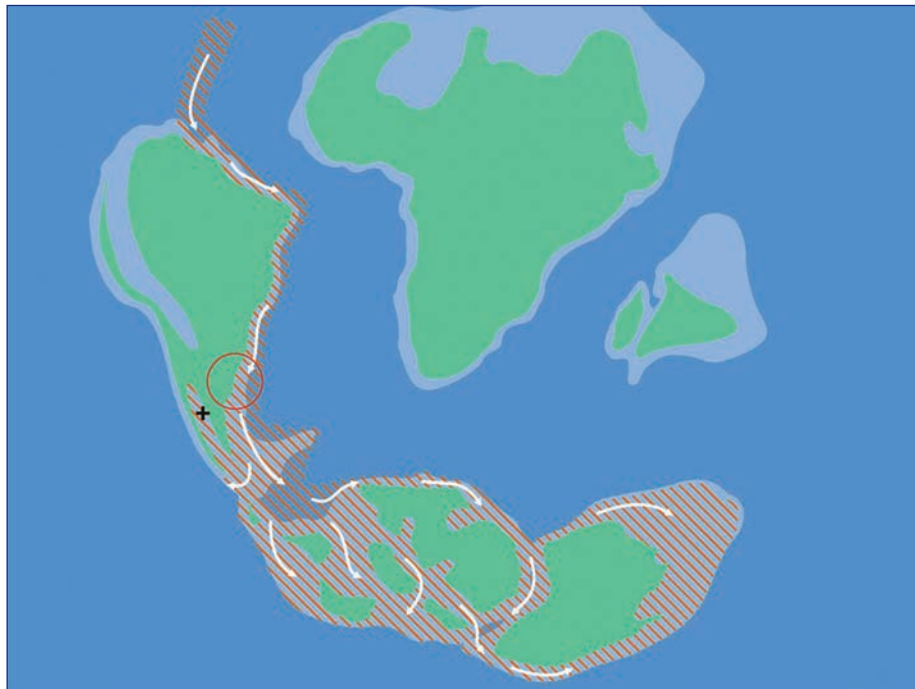
Figura 3. Ubicación de la Zona Común de Pesca Argentino-Uruguaya (círculo rojo) en la Era Mesozoica en el continente Gondwana, Periodo Cretácico tardío (66 millones de años atrás). El rayado rojo indica la distribución de la ictiofauna de probable origen Tethiano de afinidad termófila. El signo + indica la ubicación de los dientes fósiles tipo raya hallados en la Formación La Colonia.