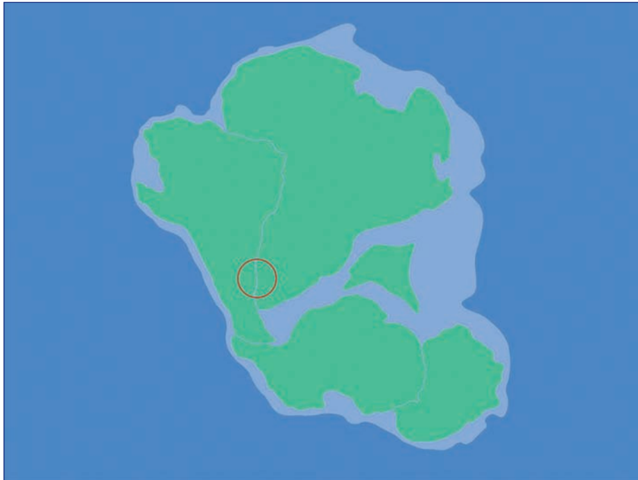
Figura 1. Ubicación de la Zona Común de Pesca Argentino-Uruguaya (círculo rojo) en la Era Mesozoica en el continente Gondwana, Periodo Cretácico temprano (140 millones de años atrás).