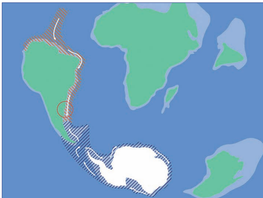
Figura 4. Ubicación de la Zona Común de Pesca Argentino-Uruguaya (círculo rojo) en la Era Cenozoica, Paleogeno-Oligoceno en el Hemisferio Sur (30 millones de años atrás). El rayado en rojo indica la distribución de la ictiofauna de probable origen Tethiano, y el rayado azul la distribución de la ictiofauna magallánica proveniente del Pacífico y/o afinidad criófila.