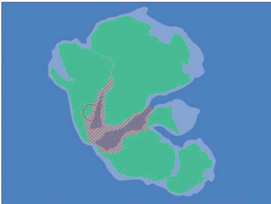
Figura 2. Ubicación de la Zona Común de Pesca Argentino-Uruguaya (círculo rojo) en la Era Mesozoica en el continente Gondwana, Periodo Cretácico medio (112 millones de años atrás). El rayado rojo indica la distribución de la ictiofauna endémica.