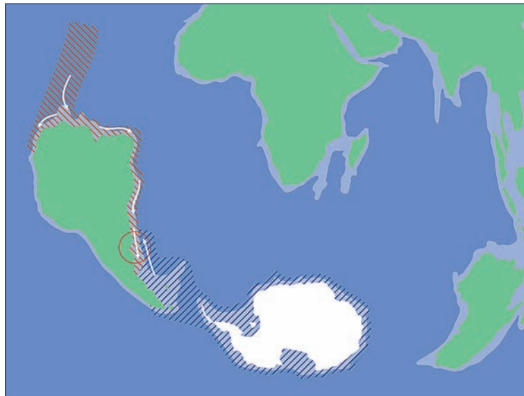
Figura 6. Ubicación de la Zona Común de Pesca Argentino-Uruguay (círculo rojo) en la Era Cenozoica, Neógeno-Holoceno en el Hemisferio Sur en la actualidad. El rayado en rojo indica la distribución de la ictiofauna de probable origen Tethiano, y el rayado azul la distribución de la ictiofauna magallánica proveniente del Pacífico y/o de afinidad criófila.