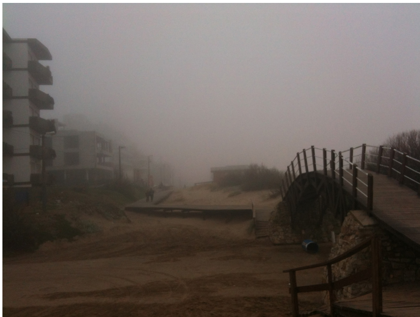
Figure 4. Villa Gesell in Winter

actividades cotidianas, la sociabilidad, el tránsito o la relación con el “recurso natural” de la playa, la arena y el mar. También exhiben cómo ciertos fragmentos del paisaje se pueden iluminar o apagar con el cambio de estación, cómo ciertas infraestructuras se utilizan y dejan de utilizarse cuando se producen las transiciones temporales: “hay partes de la ciudad que se activan sólo en verano y lo mismo pasa con el invierno [...], esas partes que están vivas en invierno el turista en realidad no las conoce” (escritor, 60 años).