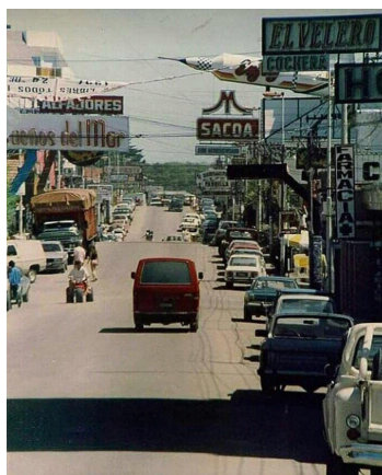
1. Avenida 3, arteria comercial, 1980