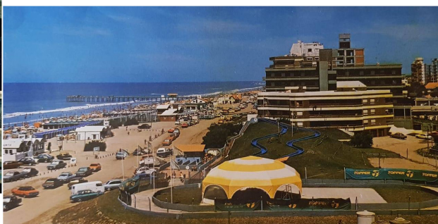
Figura 3. Infraestructuras balnearias en los años ochenta