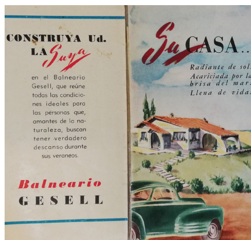
1. Folleto turístico de Villa Gesell, 1950