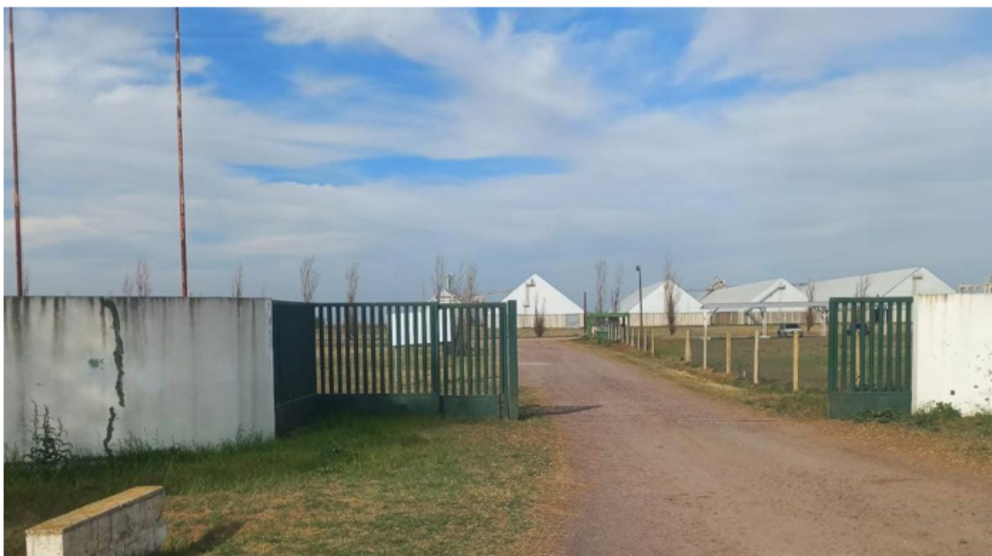
Imagen n°3. Instalaciones de empresa manisera en el ingreso de la localidad de Las Acequias