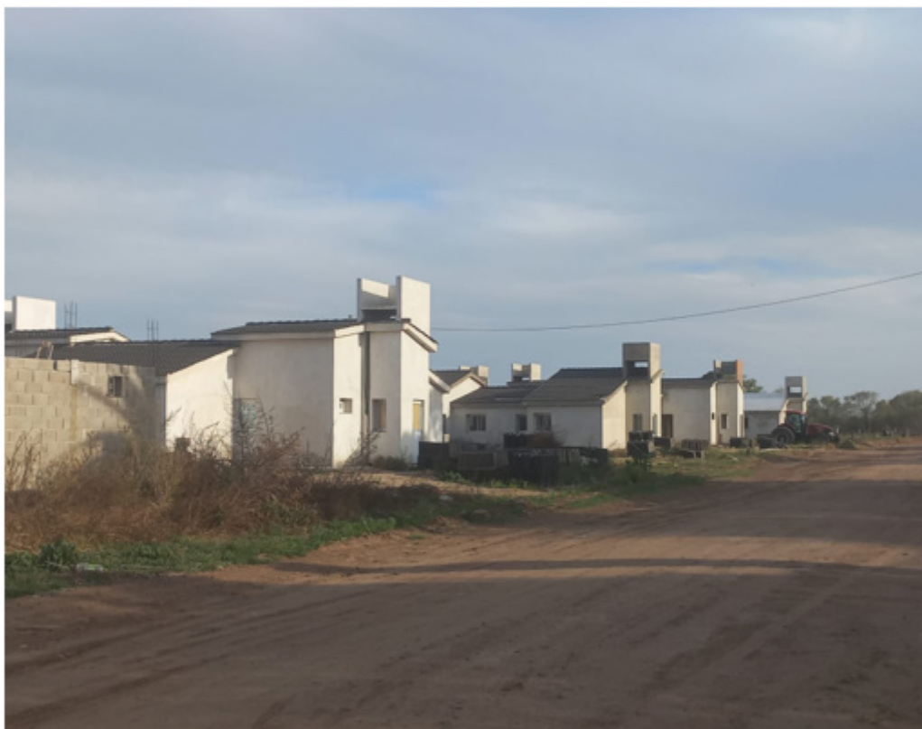
Imagen n°5. Desarrollo de viviendas familiares