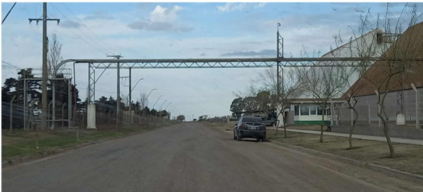
Imagen n°2. Conexión vía área del proceso productivo