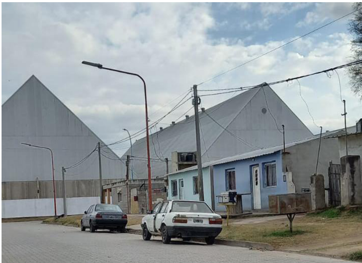
Imagen n°1. Galpones emplazados a pocos metros de la zona residencial