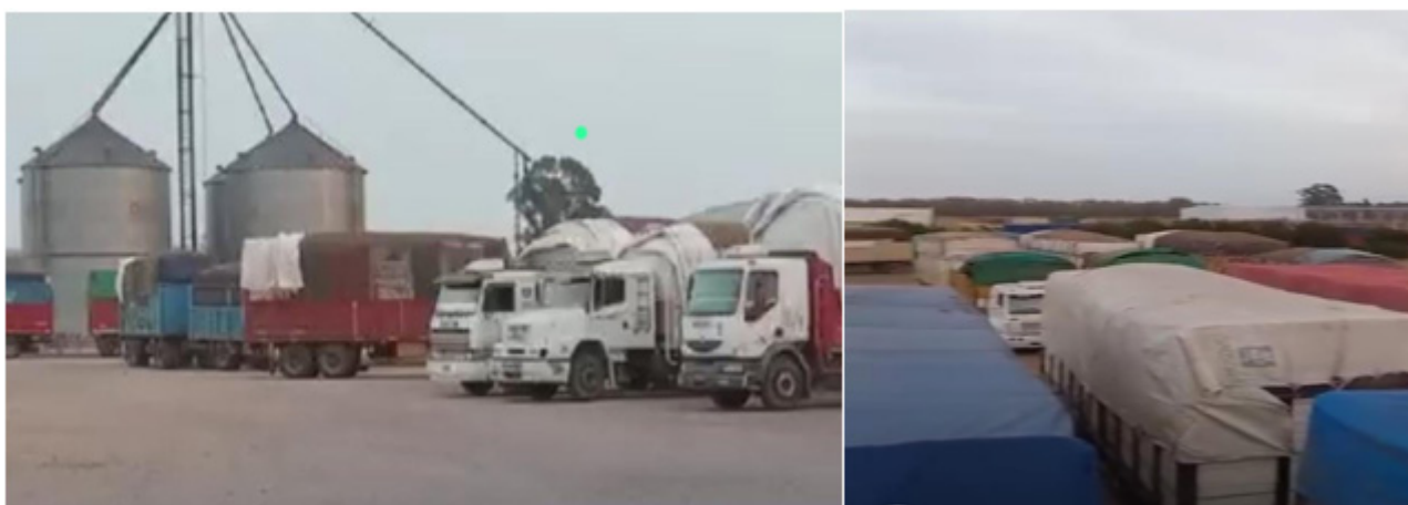
Imagen n°4. Camiones en el ejido urbano