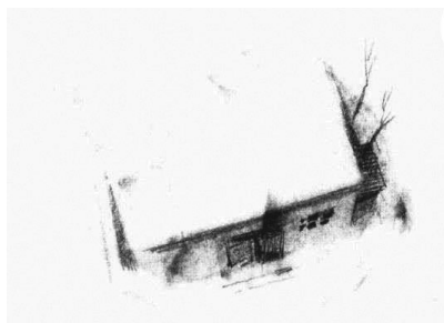
Imagen 3. Dibujo de Carlos Maiques. En Rivera Garza (2019, p. 139)