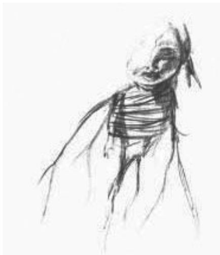
Imagen 4. Dibujo de Carlos Maiques. En Rivera Garza (2019, p. 131)

Para el niño informante, lo desconocido e irrepresentable del acto sexual se equipara con los homúnculos, por lo tanto, en su discurso, los objetos y las acciones se confunden, se amalgaman en un todo incomprensible. Después de todo “es difícil describir lo que no se puede imaginar” (Rivera Garza, 2019, p. 97). El niño relata: