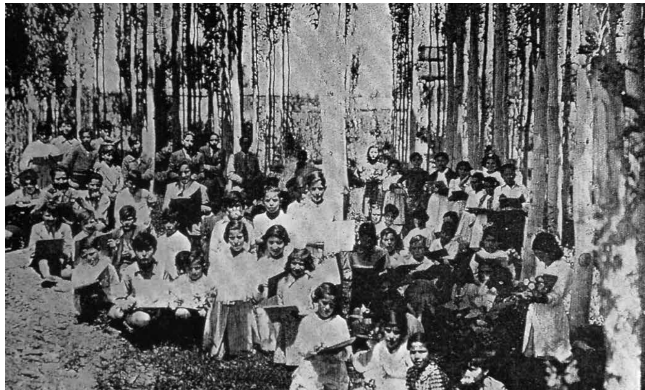
Clase de dibujo al aire libre, escuelas municipales de Godoy Cruz

Creó bibliotecas populares en las escuelas y la biblioteca ambulante en la Plaza departamental. También, la escuela municipal de Dibujo al aire libre. Propuso torneos deportivos y exposiciones escolares de trabajos realizados por alumnos. Desarrolló en 1938 la publicación Educad al Soberano , con el propósito de ser un órgano informativo de las actividades del Comité y orientar en materia de enseñanza.