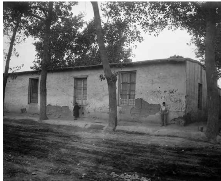
Escuela Godoy Cruz

Luego de la sanción en 1884 de la Ley 1420 de promoción de la educación común, gratuita y obligatoria las provincias adquirieron autonomía. El Gobierno de Mendoza comenzó a crear las primeras escuelas públicas. Si bien estos establecimientos se concentraron principalmente en Capital, el Álbum Escolar de 1910 muestra la existencia de una escuela pública en Godoy Cruz: la escuela N° 1 y 2, que funcionó en una antigua vivienda construida en adobe en la calle Rivadavia.