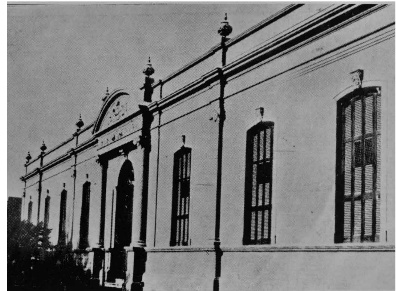
Colegio Compañía de María