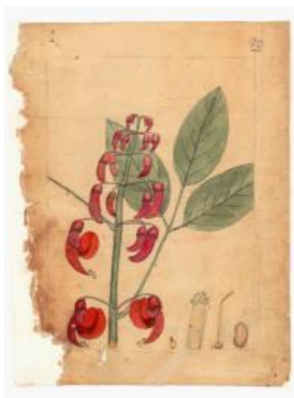
Figura 4. Ceibo .

(...) bajé al bosque de nuevo. Encontré varias especies de enredaderas, entre ellas la verdadera Zarzaparrilla Smilax y otra con hoja de grama y semilla tricoca; varias plantas que hasta ahora no había encontrado sino en las inmediaciones de Buenos Aires, cual era una nueva especie de salvia que allí había dibujado, y que se parece mucho más a la salvia oficial, que la otra especie más común que usan en nuestras boticas muy mal por hiedra terrestre, y en Maldonado por yerba de ahogos por el buen efecto que han experimentado con ella en esta fatal enfermedad (Larrañaga, 1965, pp. 79-80).