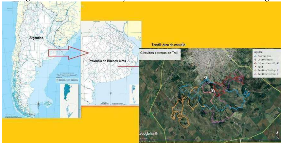
Imagen 1: Localización de Tandil y área de estudio con circuitos de trail running.