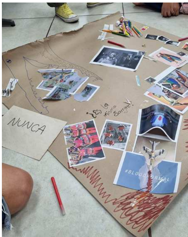
Imagen 7: Barone Zalocco, O. y Capasso, V. (2023). Taller Educar con/junto a las imágenes: potencialidades, limitaciones e incertidumbres . Ciudad de México, México. Plano detalle de la cartografía 2 "sincretismos topográficos". Registro de las autoras.

Otro de los participantes, al ser consultado por su experiencia y el trabajo entre/con/junto a las imágenes en el taller, lo enunció en tres caídas de la sacralidad de las imágenes: