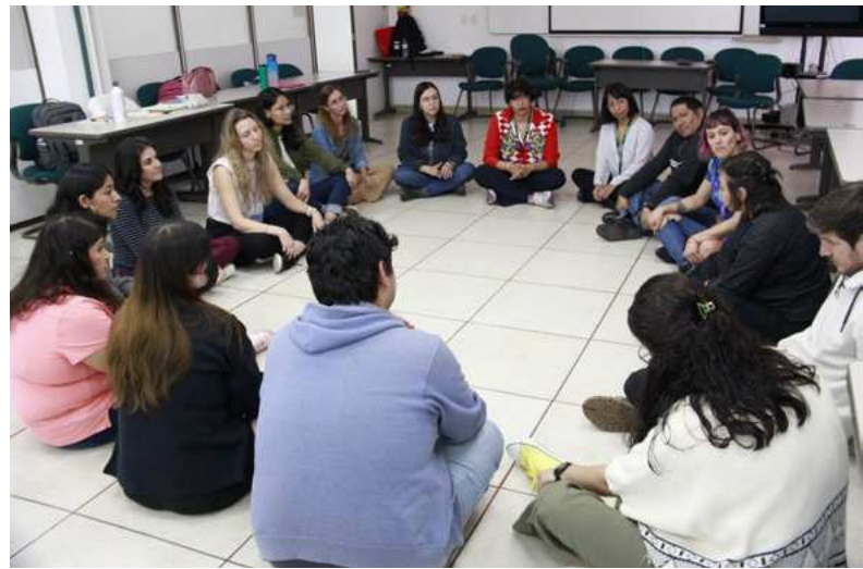
Imagen 1: Barone Zallocco, O. y Capasso, V. (2023). Taller Educar con/junto a las imágenes: potencialidades, limitaciones e incertidumbres . Ciudad de México, México. Ronda de inicio.

A partir de este conjunto de imágenes, invitamos a que cada grupo arme una cartografía, convocamos a la intervención y pérdida del respeto a las imágenes y al papel. Para ello, le dimos a cada grupo un soporte de grandes dimensiones, tijeras, pegamento, fibrones y lápices de colores. Definimos esta producción colectiva como cartografía , como posibilidad de “intercambio colectivo para la elaboración de narraciones y representaciones que disputen e impugnen aquellas instaladas desde diversas instancias hegemónicas”