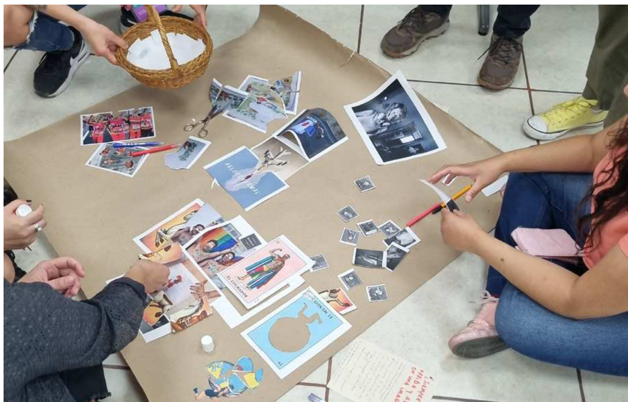
Imagen 2: Barone Zallocco, O. y Capasso, V. (2023). Taller Educar con/junto a las imágenes: potencialidades, limitaciones e incertidumbres. Ciudad de México, México. Trabajo grupal. Registro de las autoras.