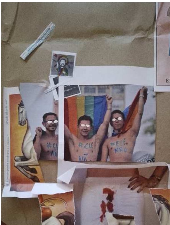
Imagen 8: Barone Zallocco, O. y Capasso, V. (2023). Taller Educar con/junto a las imágenes: potencialidades, limitaciones e incertidumbres . Ciudad de México, México. Plano detalle de la cartografía 2 “sincretismos topográficos”. Registro de las autoras.

a su vez, ellas lo hagan. Sus palabras recuperan la idea propuesta al comienzo del taller, con la frase de Anzaldúa, acerca de escuchar lo que una imagen tiene para decirnos: “Las imágenes nos hablaron y nosotros las escuchamos”. Y, a la vez, su relato reconoce que no todas las personas ven lo mismo, en tanto ello depende de contextos históricos y socioculturales, como también de identificaciones: “Estábamos viendo la misma imagen al mismo tiempo y, sin embargo, no veíamos lo mismo”.