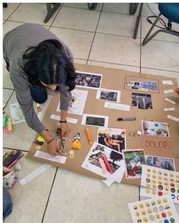
Imagen 4: Barone Zallocco, O. y Capasso, V. (2023). Taller Educar con/junto a las imágenes: potencialidades, limitaciones e incertidumbres. Ciudad de México, México. Trabajo grupal. Registro de las autoras.