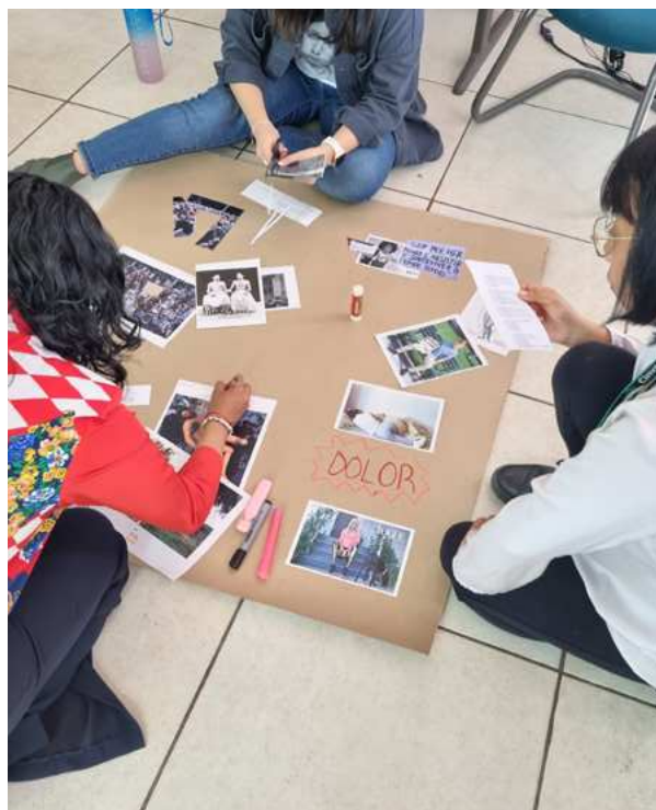
Imagen 3: Barone Zallocco, O. y Capasso, V. (2023). Taller Educar con/junto a las imágenes: potencialidades, limitaciones e incertidumbres. Ciudad de México, México. Trabajo grupal.