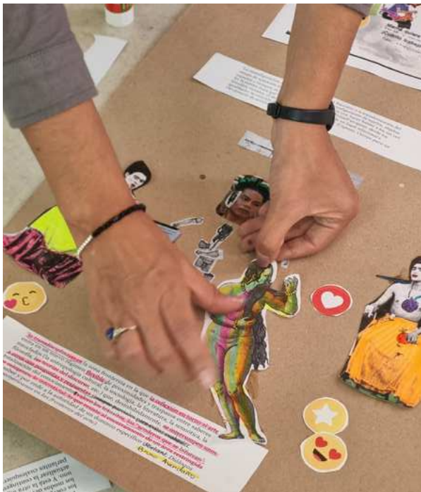
Imagen 5: Barone Zallocco, O. y Capasso, V. (2023). Taller Educar con/junto a las imágenes: potencialidades, limitaciones e incertidumbres . Ciudad de México, México. Plano detalle de la cartografía 1. Registro de las autoras.