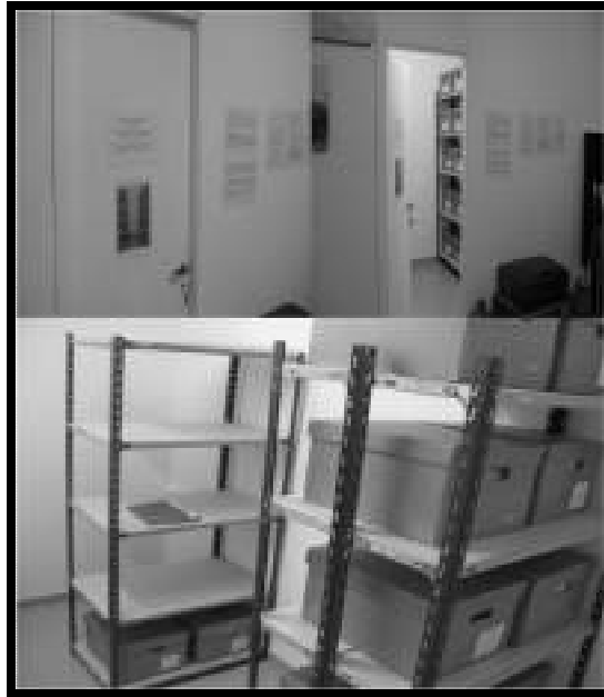
Imagen 3: Vistas de la puerta y espacio interior del Reservorio Transitorio Co-gestionado en Puerto Santa Cruz