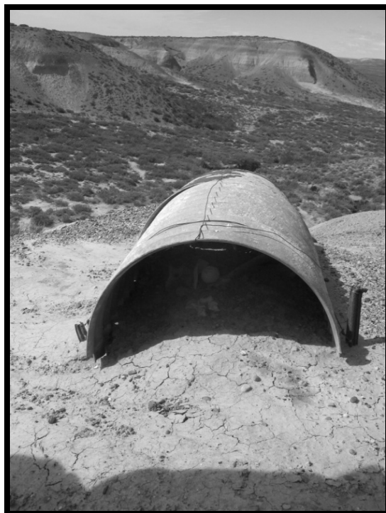
Imagen 1: Ubicación de los restos Localidad Rincón del Buque (zona de amortiguación sur del Parque Nacional Monte León).

cual se tomó conocimiento de que en las proximidades del Parque Nacional Monte León, en un lugar denominado Rincón del Buque, se exponían a la intemperie restos óseos humanos 10 como resultado de la acción erosiva del viento. El dueño del campo había protegido los restos con chapas (Imagen 1) hasta que se resolviera qué hacer con ellos.