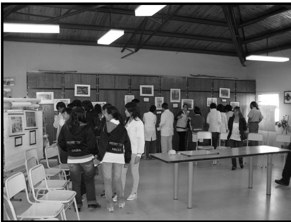
Imagen 2: Muestra fotográfica "Los indios desde los otros", en la EGB n° 6 de la ciudad de Comandante Luis Piedra Buena.

matanzas y a la discriminación, que implicaron tanto la caza de los selk'nam, como la "Campaña al Desierto" y las diversas exposiciones de indios que se realizaron en grandes ciudades del mundo. También se incluye otra cara de estos procesos, las luchas y reclamos de los Pueblos Originarios, quienes a pesar de la opresión sufrida, han pugnado por sus derechos, tanto entonces como en la actualidad. La muestra fue presentada en forma de taller, tanto en la localidad de Comandante Luis Piedra Buena como en Puerto Santa Cruz, durante los días 24 y 25 de noviembre del 2008. Concretamente se trabajó la problemática de la "discriminación humana" en el pasado y se generó una reflexión sobre la discriminación y la convivencia en la actualidad.