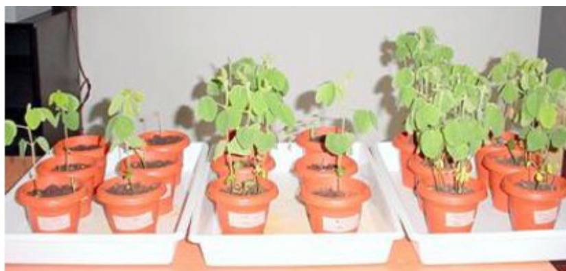
Figura 2. Ensayos con Trichoderma afroharzianum y Fusarium graminearum sobre trigo.

Es importante señalar que todas las actividades desarrolladas en el marco del convenio con JICA estuvieron contempladas en el Proyecto Específico de INTA: PNPV-1135023 "Estrategias de bajo impacto ambiental para el manejo de