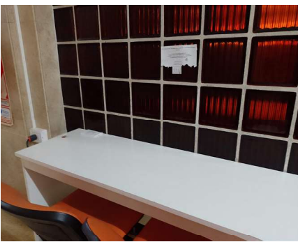
Imagen 11. Promoción de ofrecimiento de servicios