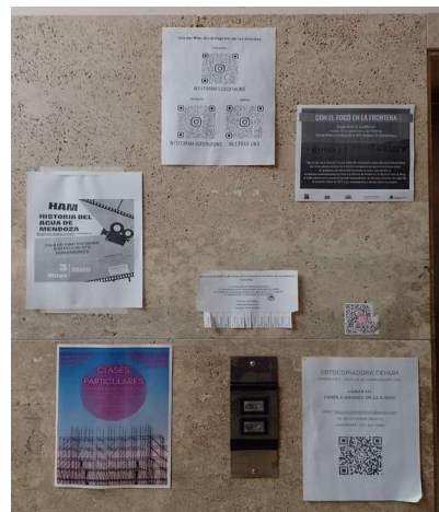
Imagen 4. Producciones exhibidas junto a una puerta de ascensor