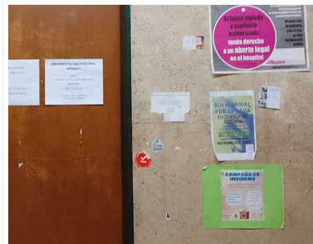
Imagen 12. Promoción del mismo ofrecimiento, junto a otros anuncios

El último aspecto que nos resta tratar en relación con el trabajo heurístico que hemos realizado es el de la elección de lengua para la formulación de los mensajes exhibidos (hablamos de elección de lengua aquí, y no de elección lingüística , para evitar la ambigüedad de este último sintagma, que puede remitir tanto a la elección entre lenguas que nos atañe como a la elección, en usos de una misma lengua, de una u otra variante en los planos fónico, morfosintáctico, etc.).