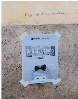
Imagen 9. Anuncio de actividad artística