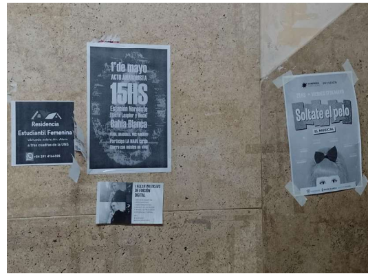
Imagen 10. Anuncio de la misma actividad, junto a otros anuncios