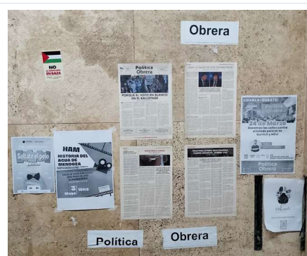
Imagen 8. Concentración de anuncios y prensa político-sectoriales