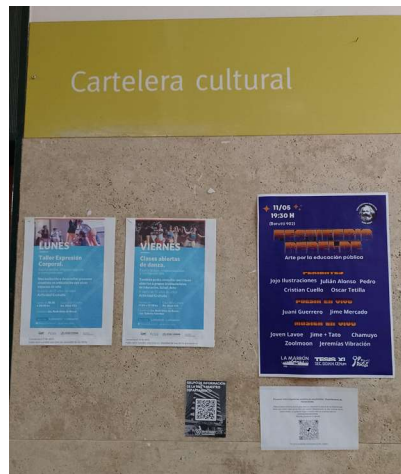
Imagen 3. Producciones exhibidas en la sección Cartelera cultural