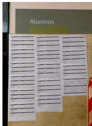
Imagen 1. Exhibición de horarios de cursado para alumnos

primera muestra una de las sectorizaciones del espacio potencial de exhibición a las que oficialmente se ha procedido, la Cartelera cultural , que da marco a cualesquiera promociones de actividades culturales, incluyendo las de iniciativa privada; la segunda, en cambio, muestra el usufructo de un lugar de exhibición, en uno de los muros de los espacios de circulación a los que atendimos, para el que no se han establecido previsiones especiales de ese tipo.