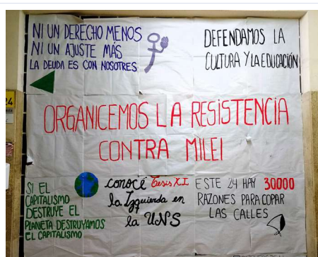
Imagen 7. Afiche de agrupación estudiantil

En el paisaje lingüístico estudiado, las estrategias (a) y (b) son empleadas principalmente por agrupaciones políticas, mientras que la estrategia (c) es empleada sobre todo para promocionar actividades artísticas u ofrecimientos de servicios. La imagen 7 muestra la operación de la primera estrategia en el cartel artesanal de una agrupación política estudiantil, que ocupa toda la pared enfrentada a la escalera en una de las plantas del edificio. La imagen 8 muestra la puesta en práctica de la segunda estrategia, con producciones de un mismo sector político en una acumulación que, si bien no excluye la exhibición de otras, hegemoniza el espacio disponible sobre la pared en la que desemboca la escalera en la planta baja. Por último, las imágenes 9 y 10 muestran cómo se ha “sembrado” en diferentes espacios el afiche de una misma actividad artística (que también aparece en la imagen 8), y las imágenes 11 y 12 lo hacen en el caso de un mismo ofrecimiento de servicios (que puede verse igualmente en la imagen 4).