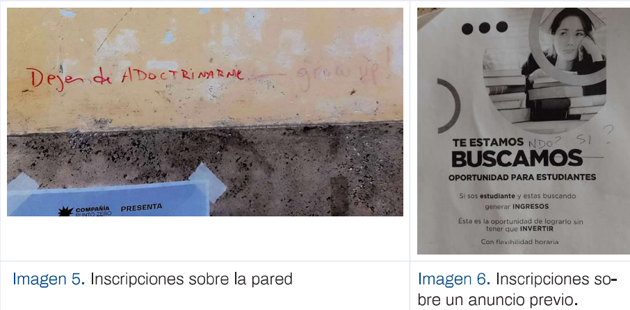
Imagen 5. Inscripciones sobre la pared