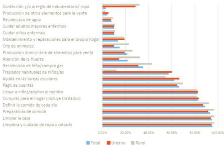
Figura 3. Tareas de cuidado que realizan las cuidadoras principales