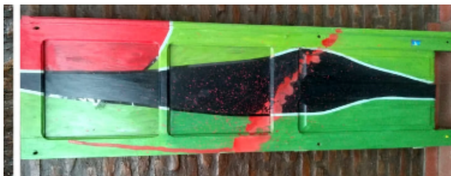
Serie Puertas Antiguas, técnica mixta. Matías Sapegno

La segunda cuestión para plantear y que fue puesta en análisis a lo largo del desarrollo se vincula con el sentido de temporalidad que reviste la formación en los términos que ha sido definida. A diferencia de la concepción instrumental y programática del tiempo que regula la capacitación, donde los cursos son evaluados con base en cantidad de contenidos y horas de cursado, la formación en el marco de un enfoque clínico se evalúa en términos de la profundidad de los procesos de retorno sobre sí a los que ha dado lugar. Estimación mucho más compleja e incierta donde no existen garantías, dado que los procesos de transformación no son anticipables. Los datos han mostrado que, en algunos casos, los propios rasgos de la forma en la que se es formador son percibidos tiempo después de la experiencia, respondiendo a una temporalidad propia, no generalizable. Sin embargo, atender a esta temporalidad peculiar y tolerarla desde la coordinación parece ser la única vía para que la formación sea posible.