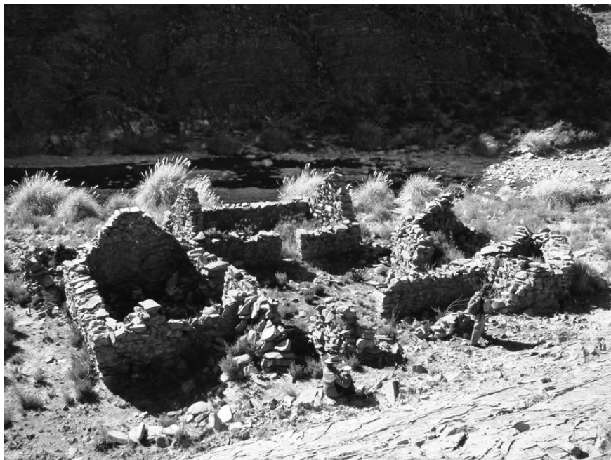
Figura 9. Vista parcial de Oratorio.

mayoría camélidos y antropomorfos) pueden ser asignados a época prehispánica, pero existen algunos que datan de época colonial.