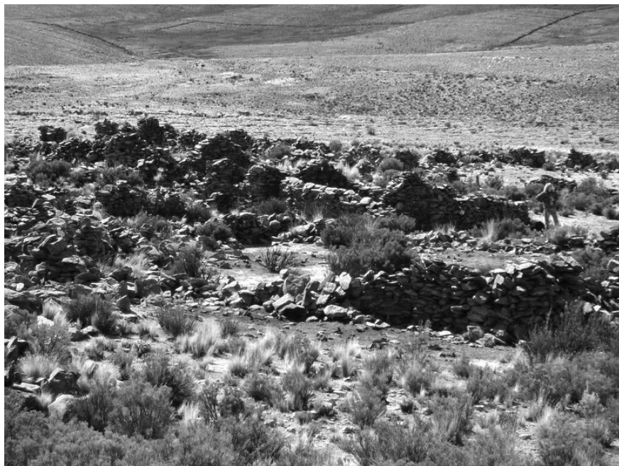
Figura 8. Vista parcial de Timón Cruz 2.

De acuerdo a la información brindada por uno de los pobladores de Timón Cruz, a unos 2 km al sudeste del poblado actual se localizan una serie de socavones antiguos para la explotación de oro en veta. No hemos podido prospectar aún esa zona, pero es probable que allí se encuentren las explotaciones mencionadas en la documentación histórica.