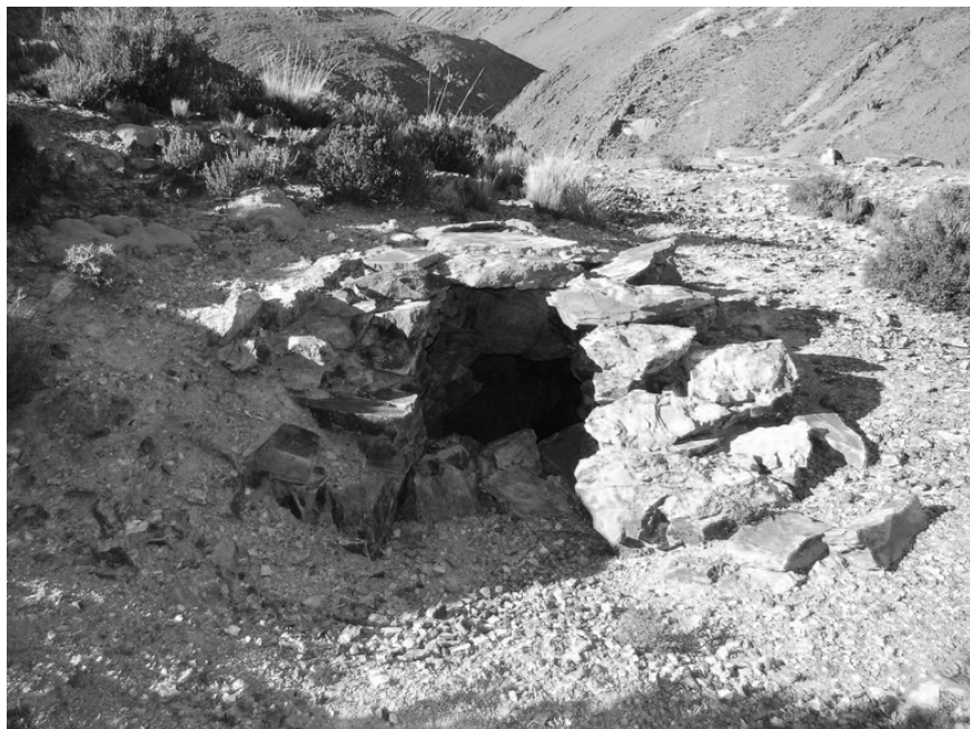
Figura 6. San Francisco. Entrada a socavón.

En el sector donde los conjuntos constructivos son más abundantes hemos registrado un patio de trabajo delimitado por un muro, con un maray y una plataforma empedrada de 1 x 1,40 m de lado en su interior, empleados para el procesamiento de los minerales obtenidos en la quebrada ( figura 7 ). Muy cerca de este patio, junto al curso del Río San Francisco, hemos registrado otro maray, en este caso de mayor tamaño.