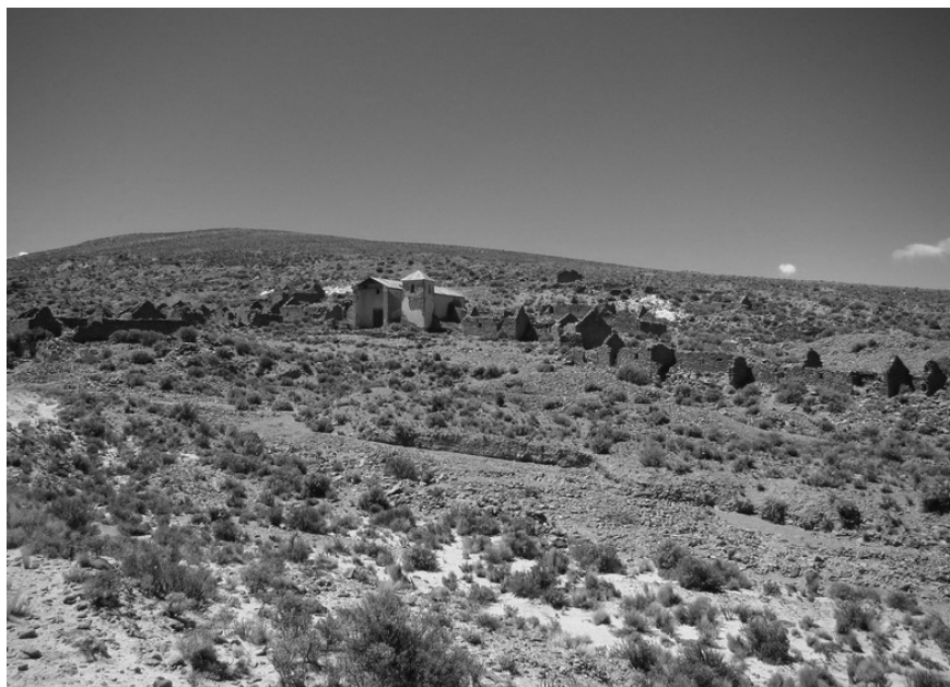
Figura 10. Vista parcial de Antiguyoc.

A excepción de Santa Catalina, los demás poblados se encuentran completamente rodeados de trincheras y pozos para la extracción de sedimentos auríferos, y de socavones para la explotación de oro en veta. Es más, en Rinconada un socavón se extiende por debajo de la plaza del pueblo, y en Antiguyoc abundan los piques en áreas de circulación dentro del poblado, y en los patios de las viviendas. En Santa Catalina, en cambio, no hemos observado evidencias de actividad minera. Es probable que el pueblo haya surgido y crecido gracias a la explotación de Minas Azules, localizada a unos 5 km al sur. De acuerdo con la descripción de Carrizo, es en “ el camino de Santa Catalina a Vallecito ” donde “ se ve a cada trecho hoyos y lavaderos hechos también para descubrir y sacar el oro de sus arenas ” (Carrizo [1935] 2009: 29). La ubicación del poblado, a orillas del Río Santa Catalina, habría permitido el acceso fácil al agua, recurso temporario y escaso en Minas Azules.