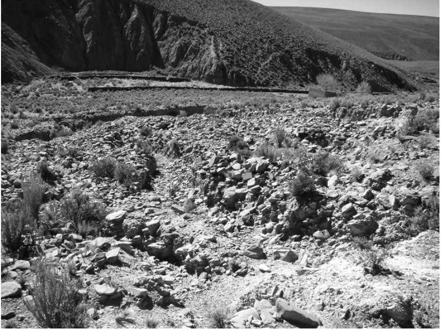
Figura 2. Santo Domingo 1. Pozos y trincheras para explotación aurífera.