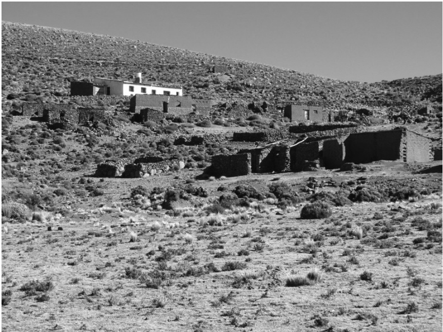
Figura 11. Vista parcial de Mina Eureka (Tagarete).

Entre los lugares reconocidos en el terreno hemos localizado Mina Eureka (antiguamente llamada Tagarete) y El Torno, ambas en el departamento de Santa Catalina. En estos casos se trata de minas explotadas intensamente a fines del siglo XIX y aún durante el siglo XX, pero que, de acuerdo con la documentación histórica disponible, habrían sido trabajadas originalmente en época colonial ( figura 11 ). No hemos podido, sin embargo, identificar en el campo evidencias asignables a aquella época. Es probable que la magnitud de los trabajos modernos realizados y la tecnología empleada en las labores mineras (maquinaria pesada, por ejemplo) hayan destruido los indicadores de explotación colonial. De todas maneras, en ambos casos, las tareas más antiguas no parecen haber alcanzado una gran escala, y de acuerdo con Zappettini y Segal (1999) se habrían realizado únicamente a cielo abierto. Las explotaciones no dieron origen a poblados, como en Antiguyoc o Santo Domingo, ni se observan ruinas de conjuntos habitacionales coloniales, como en San Francisco o Timón Cruz.