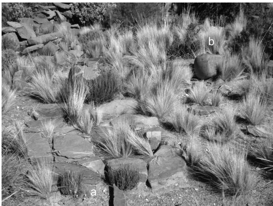
Figura 7. San Francisco. Patio de trabajo. Referencias: a: plataforma empedrada; b: maray.

estas evidencias se asocian unas pocas estructuras de planta circular, con muros de lajas y argamasa, con techo en falsa bóveda y un diámetro que no supera los 2m.