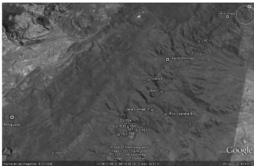
Figura 4. Ubicación de los sitios de explotación aurífera del sur de Pozuelos. Referencias: ○: áreas de lavado asociadas a refugios temporarios; □: poblados de relevancia a nivel regional; SJ: San José; LPC: Laguna Pampa Colorada; LSD: Laguna Santo Domingo; CRH: Cabecera de Río Herrana.