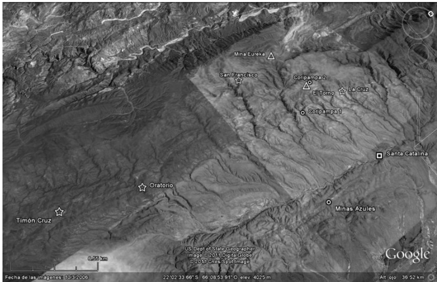
Figura 5. Ubicación de los sitios de explotación aurífera de la cuenca del Río Santa Catalina. Referencias: ○: áreas de lavado asociadas a refugios temporarios; □: poblados de relevancia a nivel regional; ☆: áreas de explotación vinculadas a núcleos habitacionales dispersos; △: centros mineros del siglo XIX con registro de explotación previa.

a 1 km de distancia del actual poblado de La Cruz se conservan pozos, trincheras y socavones asociados a núcleos habitacionales dispersos.