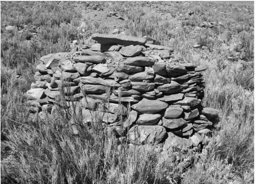
Figura 3. Laguna Pampa Colorada 1. Refugio.