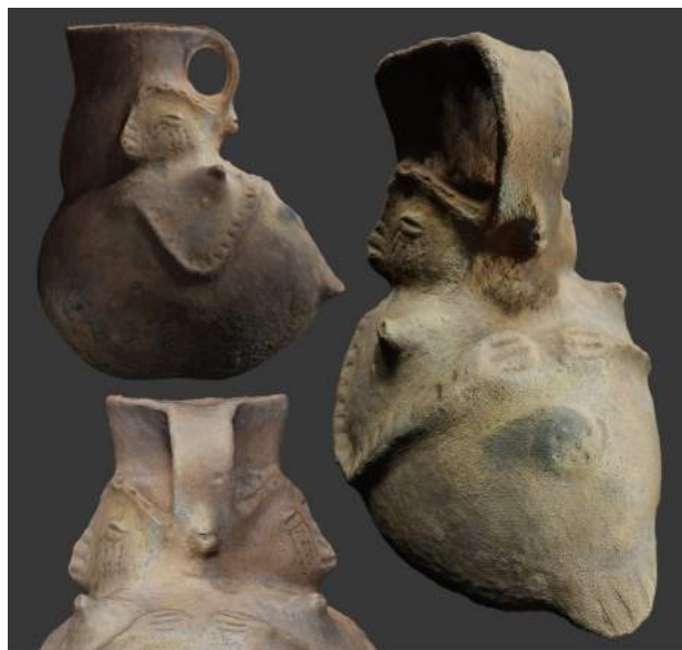
Figura 2. Diferentes vistas de la pieza con motivos de mujer-ave, imágenes realizadas del modelo tridimensional con el programa Blender.

El panorama respecto a estas cuestiones aún debe ser ampliado, las cosmovisiones pasadas no están vetadas a la arqueología. En este trabajo se proponen posibilidades de significados y relaciones. El análisis integrado de contextos, muestras de laboratorio, comparaciones estilísticas y la interpretación semiótica nos proveen de un panorama amplio e interpela nuestro entendimiento sobre el pasado, permitiéndonos tratar temáticas poco abordadas.