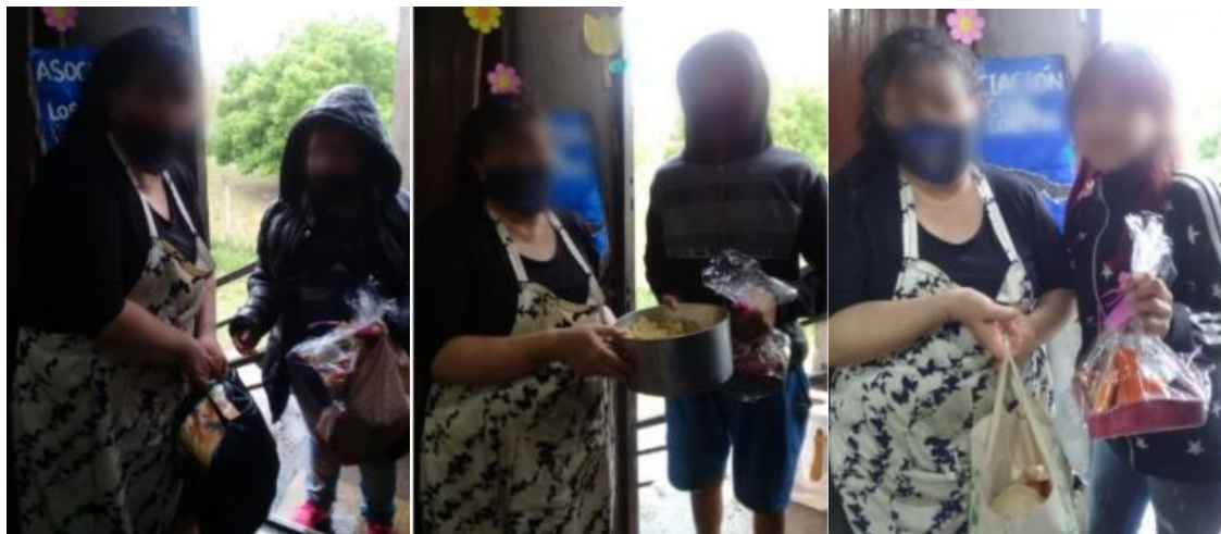
Fotografías 7, 8 y 9