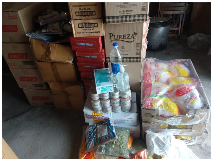
Comedor en General Pueyrredón.