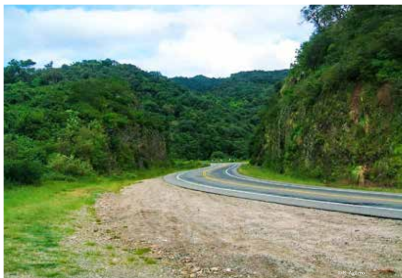
Cuesta del Totoral.

Acceder a información adicional en la web de la RELCOM