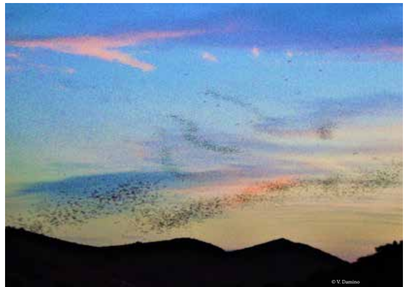
Salida de la colonia.

Acceder a información adicional en la web de la RELCOM