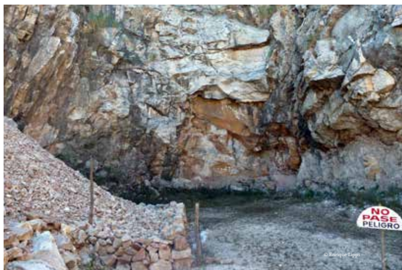
Entrada Caverna El Sauce.

Acceder a información adicional en la web de la RELCOM