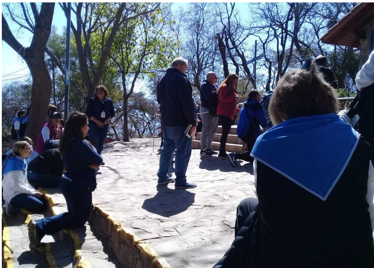
Imagen 3. Peregrinos y servidores en el santuario de la cima

Las observaciones de campo realizadas por la autora en el primer semestre de 2022 arrojan como resultado que las visitas en días de semana se han incrementado significativamente. No es raro observar a medio centenar de personas rezando frente a la capilla, aún en plena siesta (Imagen 3). Paralelamente, han disminuido las enormes multitudes de fieles que solían congregarse en fines de semana. Dicha tendencia puede explicarse por la suspensión de la “oración de intercesión” tradicionalmente encabezada por la vidente, o tal vez como consecuencia de las restricciones impuestas a los actos multitudinarios durante los años 2020 y 2021. También parece haber disminuido el número de servidores en el santuario, que en días de semana puede estar limitado a cuatro o cinco personas, a quienes suele encontrarse practicando tareas de jardinería.