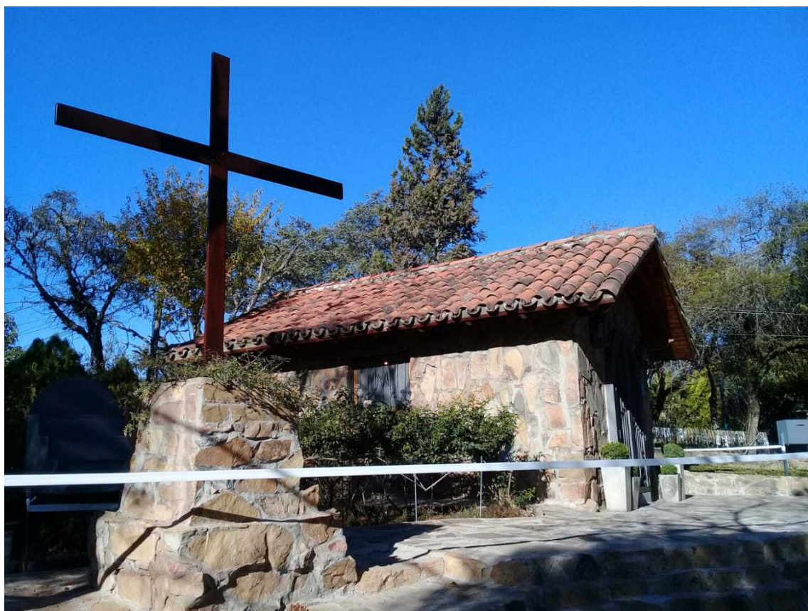
Imagen 2 - Cruz y capilla en la cima del Cerro de la Virgen

Divino Corazón Eucarístico de Jesús (véase link en referencias citadas), en el marco de dichas apariciones se le encomendó la construcción de “un santuario en un lugar elevado”, obra que se inició en Mayo de 2001 con la erección de una cruz en la cima de un cerro vecino, a unos quinientos metros sobre la ciudad de Salta. Comenzó también la construcción -con piedras del lugar- de una ermita junto a la cruz cumbreña, destinada a alojar una imagen de Nuestra Señora (Imagen 2).