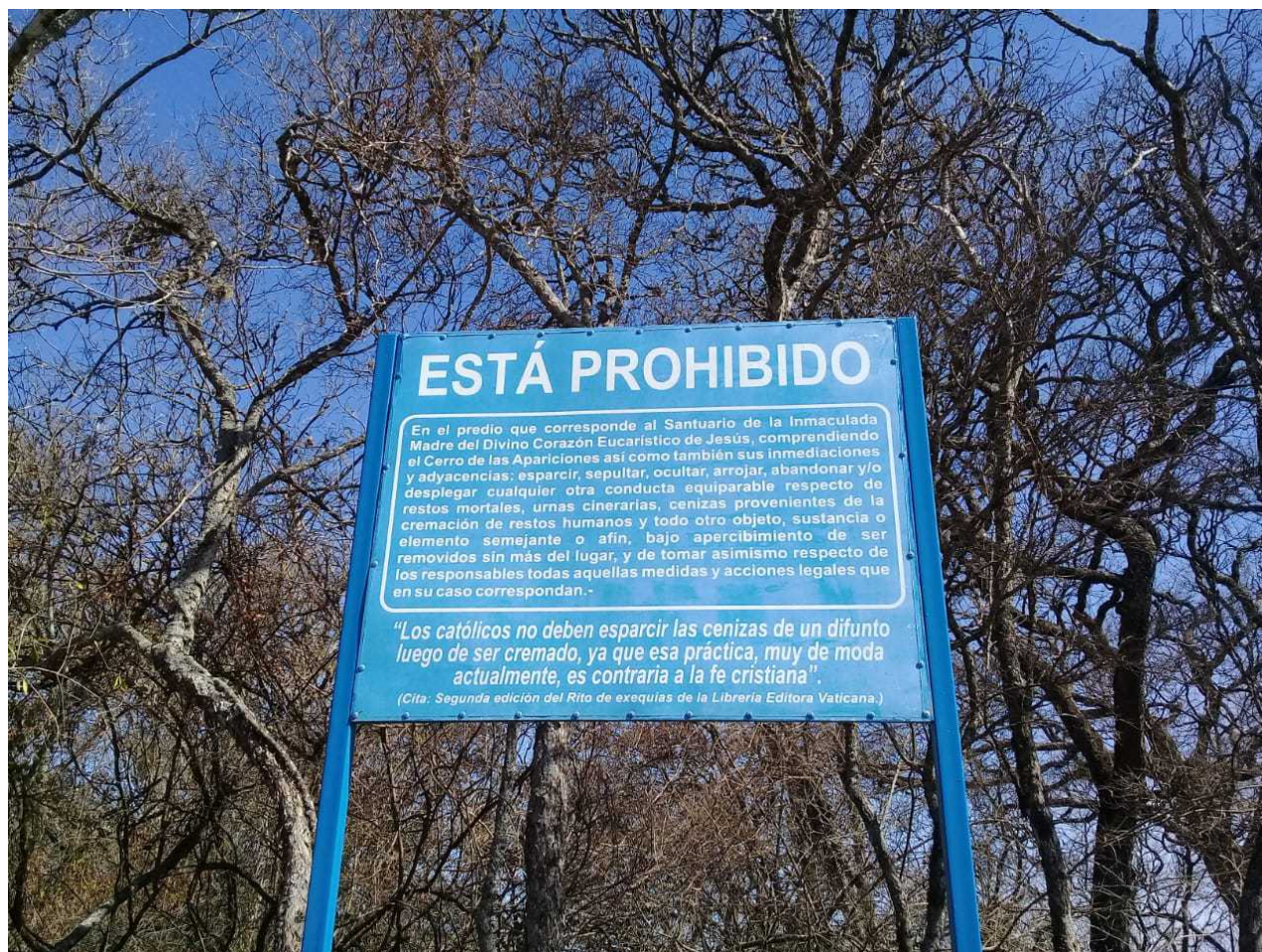
Imagen 6. Cartelería prohíbe esparcir cenizas de difuntos

queda explícitamente prohibida (Imagen 6). Este tipo de ritos asociados a la cremación han sido estudiados en otros escenarios de altura latinoamericanos, por ejemplo, en la cima del santuario mariano del Cerro Verdún en Uruguay (Ceruti, 2021). Además, han sido referidas a la suscripta por parte de colegas arqueólogos, norteamericanos y europeos, que han documentado su alarmante crecimiento en cumbres de montes de fácil acceso (Paul Depascale, comunicación personal en el Parque Nacional Yosemite de California, en 2007 y Juantxo Agirre, comunicación personal durante ascenso al monte Txindozki, en el País Vasco, en 2011).