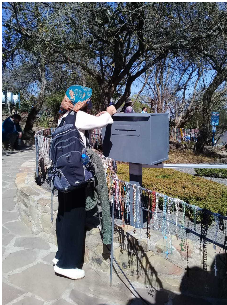
Imagen 4. Devota coloca intenciones escritas en buzón junto a rosarios dejados como exvotos

Junto a la capilla existe un buzón para plegarias escritas, a cuyo frente se dispone una pila de pequeños papeles en blanco y bolígrafos (Figura 4). Es tal la velocidad de llenado del buzón ante el fervor con el que los devotos depositan sus peticiones, que una voluntaria permanece de pie en el área para atender solícitamente al cambio de bolsas que las contienen. Respondiendo a la pregunta acerca del destino de las peticiones escritas, informa que es “dejarlas a los pies de la Madre, cuando se aparece a la vidente”.