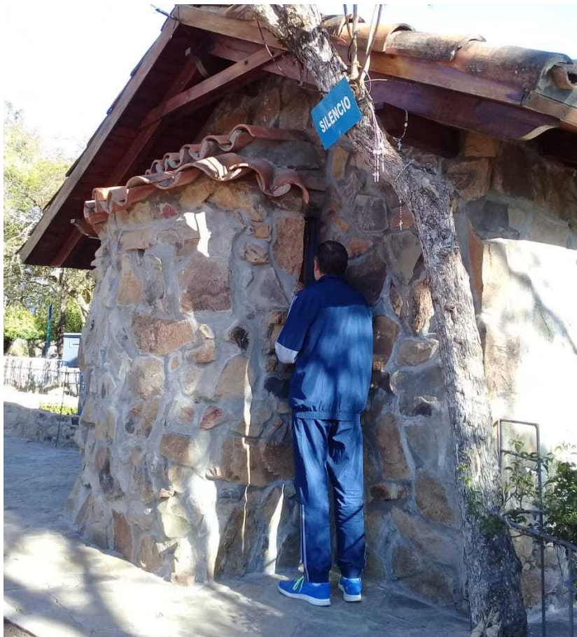
Imagen 5. Devoto contempla imagen de la Virgen por ventanita trasera de la ermita

La prohibición de ingreso al interior de la capilla en la cima del cerro ha dado sustento a novedosos gestos rituales que podrían caratularse como “estrategias de resistencia”. En todas las visitas al santuario realizadas durante el invierno de 2022 se observó a devotos que rodeaban la capillita para acercarse a la parte posterior de la edificación, donde dos angostas ventanitas vidriadas permiten visualizar mucho más de cerca la imagen de la Virgen. Algunos se detienen allí largos momentos en oración; otros pasan más velozmente, tocando el vidrio y persignándose en señal de respeto (Imagen 5).