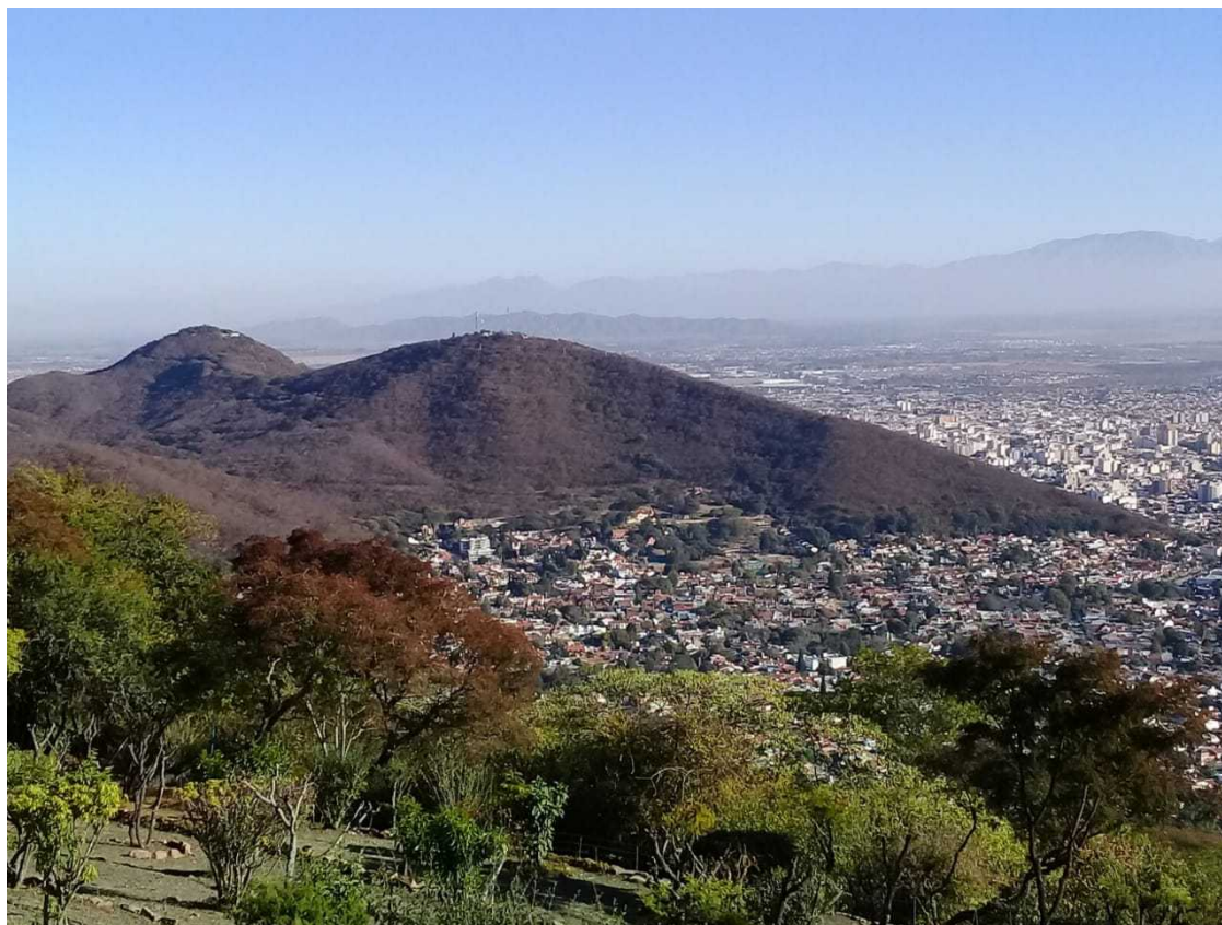
Imagen 1. Cubierto de vegetación de nuboselva, el monte "de las Apariciones" domina el barrio salteño de Tres Cerritos

El llamado Cerro de la Virgen se eleva aproximadamente mil quinientos metros sobre el nivel del mar, constituyendo uno de los puntos orográficos de mayor altura que delimitan a la ciudad Salta por el este. Forma parte de la cadena de las Sierras Subandinas, cordones cubiertos de una densa vegetación característica del ecosistema de selva nubosa o yunga , en los que predominan especies arbóreas como el lapacho, el jacarandá o el cebil (Imagen 1).