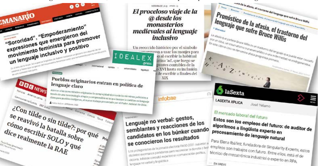
Figura 1. Titulares en torno a la complejidad del lenguaje. Fuentes: Infobae , 2021; Sánchez-Monge, 2022; Álvarez, 2023; El Universal , 2023; Semanario , 2023; Yélamo , 2023.

La pregunta: ¿Qué es el lenguaje? podría y debería ser sustituida por otra, según Kristeva (1999): ¿Cómo ha podido ser pensado el lenguaje? Abordar el problema de esta manera implica rechazar la búsqueda de una presunta “esencia” del lenguaje y en su lugar, enfocarnos en la práctica lingüística. Para esto, veamos los titulares que se presentan en la Figura 1.