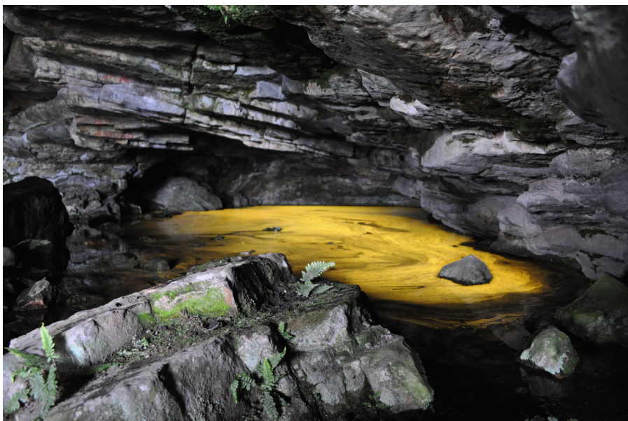
Figura 2. Vista del fondo de la gruta del Oro, donde se observa el cuerpo de agua con los reflejos dorados.

En el fondo de la cueva había un cuerpo de agua permanente con reflejos dorados intensos (de ahí el nombre de la gruta del Oro), pero en aquel momento ya hacía años que no se observaban. En la actualidad se pueden ver con frecuencia estos reflejos dorados.