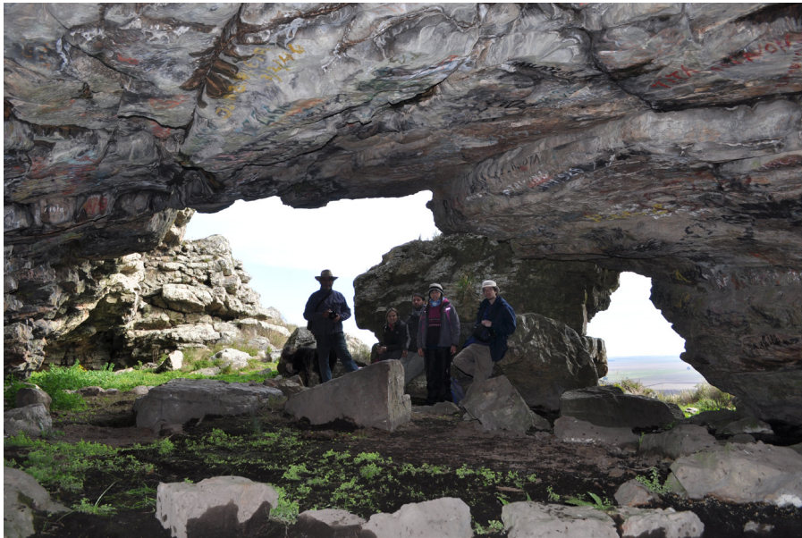
Figura 1. Vista actual de la entrada (“abrigo”) desde el fondo de la cueva de la Gruta de Oro.

En el fondo de la cueva había un cuerpo de agua permanente con reflejos dorados intensos (de ahí el nombre de la gruta del Oro), pero en aquel momento ya hacía años que no se observaban. En la actualidad se pueden ver con frecuencia estos reflejos dorados.