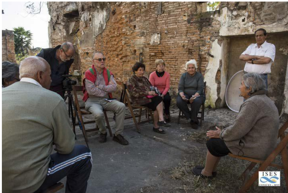
Figura 3. Proyecto expositivo “Ingenio Lastenia, 132 años de existencia productiva, 1834-1966. Memoria, lucha, esperanza”